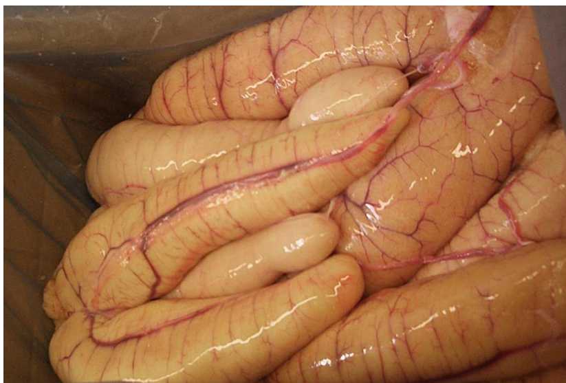
Bilde 4 Rogn fra lange

Rogn fra villfanget lange (Bilde 4). Sesongen er fra mai til juni, og ved uttak fra fisken er det viktig at rogn ikke skades, og at den renses fri for leverrester, blod, og andre innmatrester (Faktaark Langerogn, 1999). Det er vanlig å fryse rogn inn, i for eksempel 5 kilos kartonger (Bilde 4). Frosset langerogn eksporteres vanligvis til Spania.