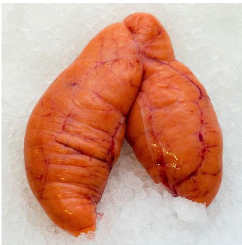
Bilde 2 Torskerogn - En kjønnsmoden skrei kan ha cirka 200 000 egg per kg av sin egen kroppsvekt.