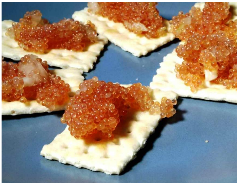
Bilde 3 En aperitiff med rognkjeksrogn. (Kilde: https://www.matoppskrift.no/oppskrift/kaviar-av-rognkjeks-2 ).