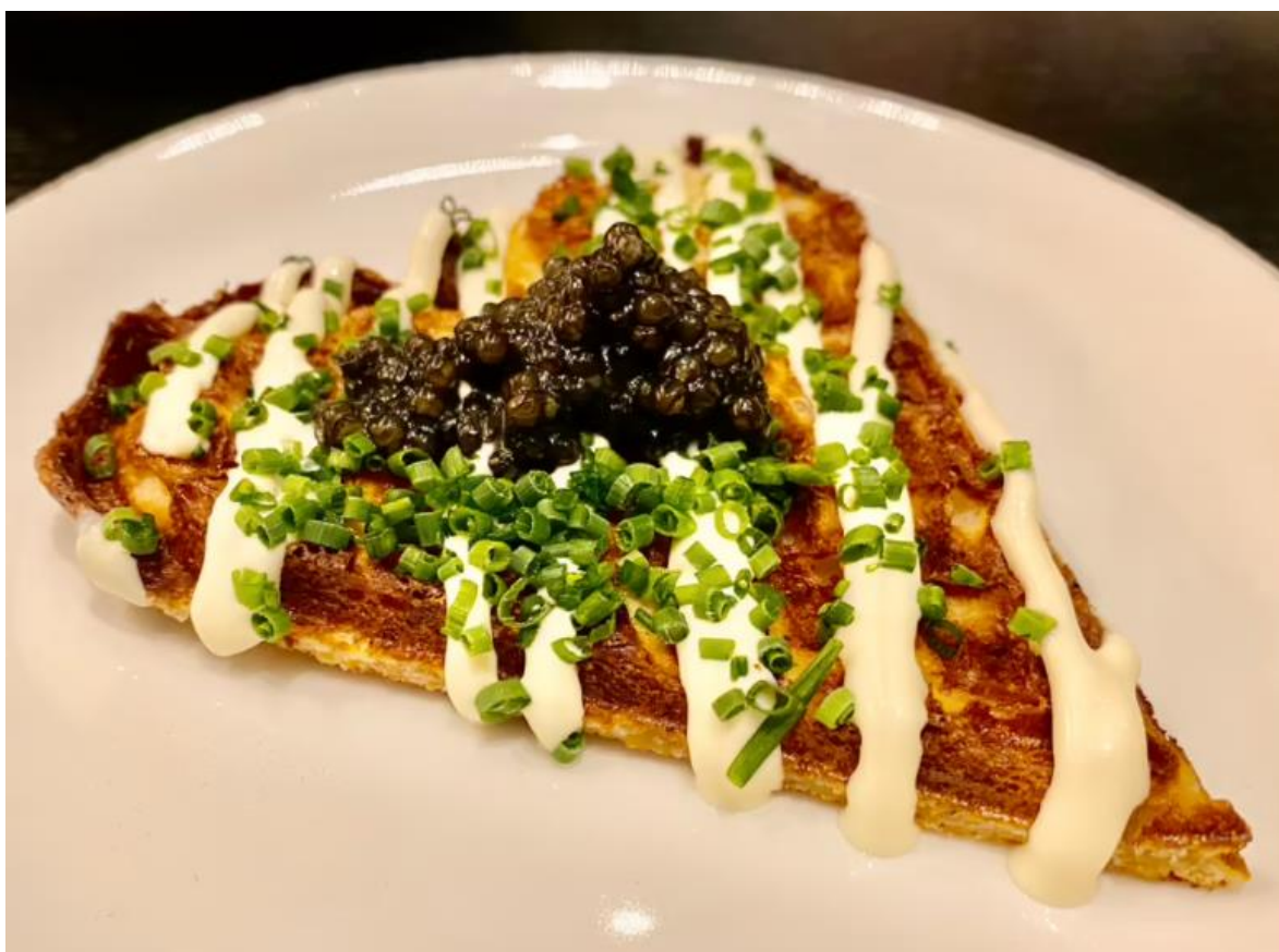
Bilde 1 Sprøstekt vaffel med rømme, gressløk og Oscietrakaviar fra russisk stør

Delmål 1–5 representerer prosjektets arbeidspakker 1–5. Arbeidspakke 6, er å utferdige et faktaark basert på funn i prosjektet. Resultatene vil sammenfattes i en fagrapport (denne rapporten) som vil gjøres åpent tilgjengelig på fhf.no og på nofima.no.