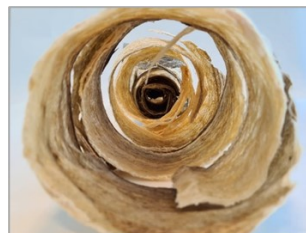
Bildet viser fiskeskinn fra tørrfisk. Produktet er interessant som råstoff til ekstraksjon av kollagen.

Torskeskinn er et etterspurt råstoff for ekstraksjon av marint kollagen. Ved produksjon av enkelte lutede og utvannede tørrfiskprodukter, tas skinnen av. Dette er semitørt og et relevant råstoff for produksjon av marint kollagen.