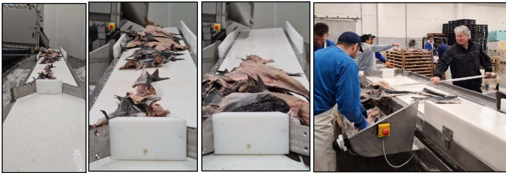
Figur 6: Det er utviklet en transportløsning ut fra trommelen.

Trommelen har nå så høy virkningsgrad at den er tatt i bruk i daglig drift. Trommelen har god funksjon for liten sei. I tillegg virker det som at den også kan brukes på andre fiskearter, når fisken er liten, uten å redusere produktkvaliteten. Trommelen har bidratt til en dobling av antall paller som legges om, pr. dag. I tradisjonell omlegging beregnes det 10-12 minutter for å legge om en palle, mens med trommelen er denne redusert til 5-6 min. Det er to hovedfaktorer til denne kapasitetsøkningen. Med trommelen er det trommelhastighet og innmating som bestemmer tempo, ikke arbeiderene. I tillegg er saltet tilnærmet fjernet fra golvet, slik at arbeidsoppgaver som å koste, spa og kjøre vekk salt er kraftig redusert. For ScanProd betyr denne kapasitetsøkningen at de nå kan legge om opptil 80 paller om dagen, mot 40-50 tidligere. Verdien av denne effektiviseringen anslås til rundt 1 000 000,- for bedriften.