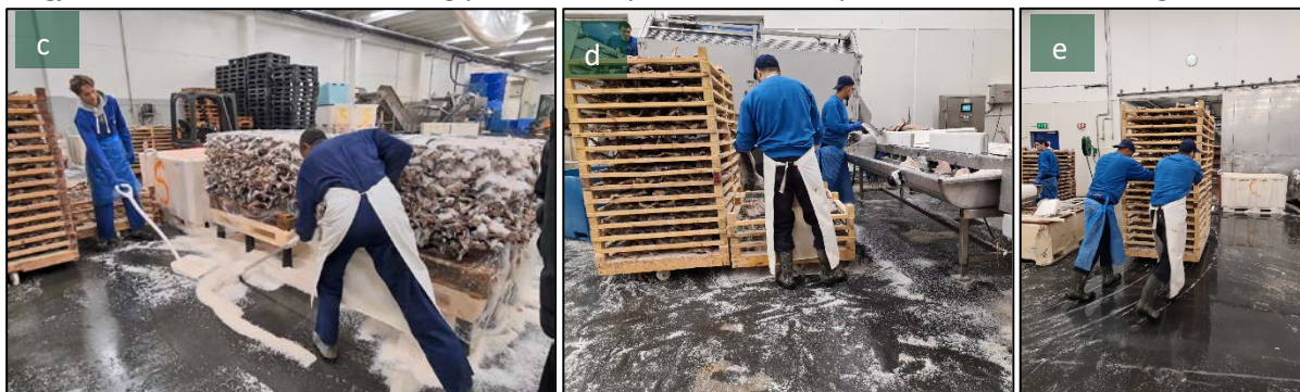
Figur 5: Ved tradisjonell omlegging (bilde 5c) slås alt det overflødig saltet ned på golvet, og det brukes tid og ressurser til å samle og fjerne det. På en effektiv dag kan dette dreie seg om volumer opp mot 10 tonn. Når trommelen samler saltet rett i kar, blir det mye mindre salt på golvet, og dermed en lettere og tryggere arbeidsplass (bilde 6de).

Saltmengden på golvet er kraftig redusert, og dette er illustrert i figur 5. Bedriften vil fortsette å utvikle løsninger som samler opp mer av saltet, slik at det blir enda mindre salt liggende i produksjonen. Dette vil de gjøre ved å tette flaskehalsen og plassere kar på flere steder i prosessen, om nødvendig.