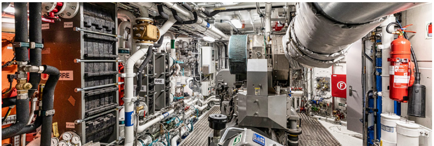
Det blir færre båter, men de blir større og får økt motorkraft. Målt i antall hestekrefter har kapasiteten økt med mellom fem og ti prosent siden 2014. Mye tyder heldigvis på at overkapasitet i flåteleddet ikke er så dyrt, og det står mange som gjerne vil inn dersom det skulle vise seg at fangstkapasiteten er blitt for liten.