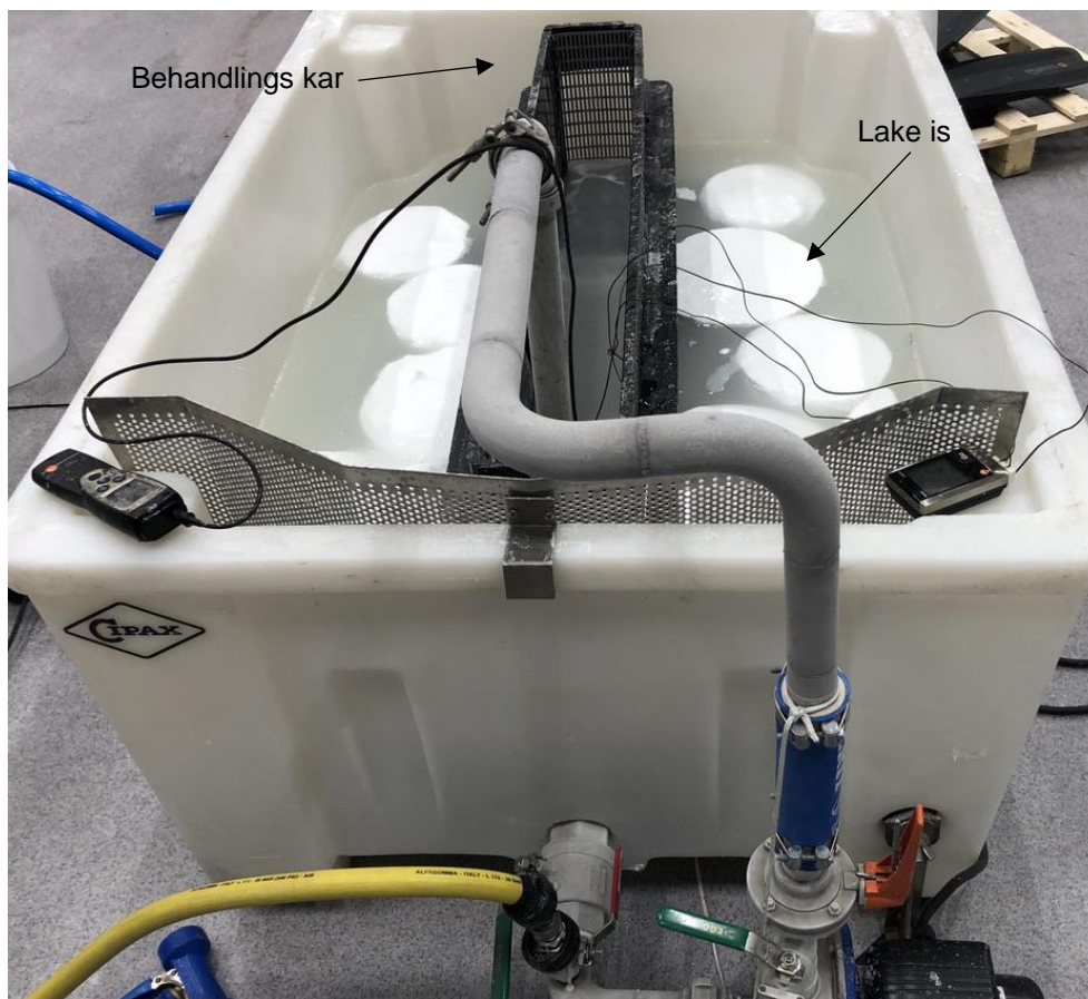
Figur 1 Apparatet som ble brukt til bedøving ved ultra-lav temperatur. Underkjølt lake med lake-is blir pumpet fra det største (hvite) karet inn i et smalere behandlingsskar (i midten, svart). Under forsøk ble all lake-is lagt på den ene siden av behandlingsskaret.

Det ble konstruert et system for å kunne gjennomføre behandlingen med så kontrollerte betingelser som mulig. Selve bedøveren bestod av et 15 cm bredt kar som fikk pumpet kald lake fra et større kar (Figur 1). Systemet bestod av underkjølt lake med et overskudd av lake-is for å holde temperaturen lav og stabil. Behandlingskaret var plassert i det største karet slik at laken hele tiden ble resirkulert og holdt kald av det største karet. Hastigheten på laken i behandlingsskaret var 0,1 m/s og fisken ble plassert i retning mot strømmen.