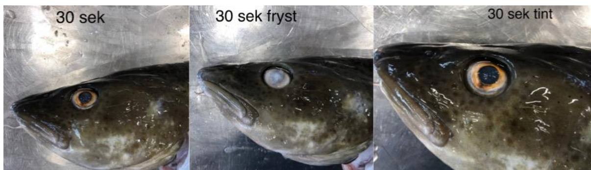
Figur 3 Viser en fisk som var behandlet i ultra-kald lake i 30 sekunder; før (venstre), liker etter (midten) og etter tining (høyre).

Det ble ikke lagt veldig stor vekt på disse resultatene, men det ble gjennomført som en del av varsom tilnærming i forkant av forsøk med levende dyr. Observasjon av synlige ytre skader etter behandling av døde dyr vil kunne ha medført begrensinger i påfølgende forsøk.