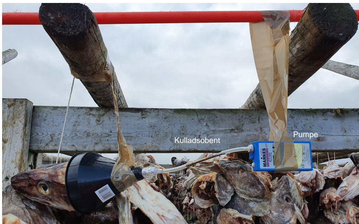
Figur 2. Oppsamling av flyktige komponenter fra hode på hjell.