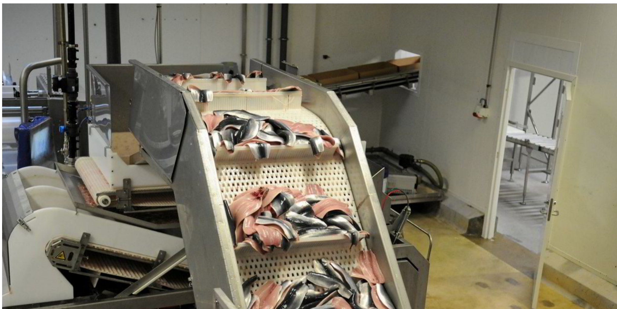
Pelagia Måløy, filetfabrikken i Måløy. Produserer både filet og fryst, rund fisk. Tar imot sild denne dagen. Sildefilet, filet, filetproduksjon.