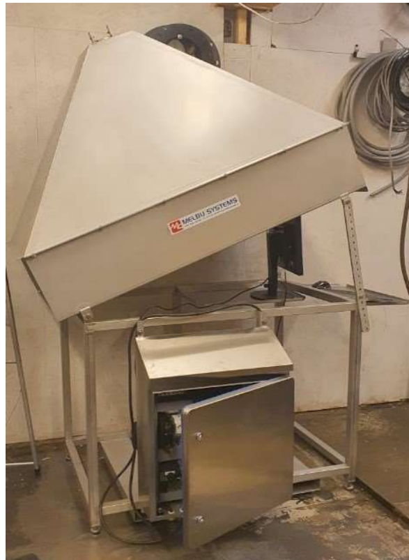
Figur 1. Prototype skanner fra Melbu Systems AS

Pga. dårlig vær ble det første ordinære forsøket utsatt, og ved neste mulighet 26.mai 2021 var det kun mulig å kjøre test fra merd til merd, og ikke fra båt til merd slik det var opprinnelig planlagt. Skanneriggen måtte ombygges noe, slik at det lot seg gjøre å stå støtt på merden i stedet for å henge på rekkverket til en båt. På forsøket ble det sendt 550 stk. torsk gjennom skanneren der 50 stk. av disse ble veid individuelt og de 500 stk. andre batchvis fordelt over 16 batcher. Fisken ble trengt i merden før den ble håvet ut i en stor håv. Videre ble en og en fisk sluppet ned på sorteringsbordet før fisken ble ledet gjennom skanneren og så ned i merden igjen.