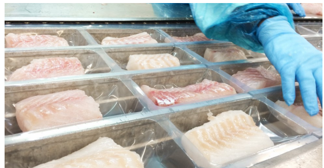
Figur 2: Pakking av hvitfisk.

ler om å bevare mest mulig av denne kvaliteten. Innfrysning bør deretter gjennomføres så raskt som mulig for å forsinke forringelsesreaksjonene i fisken. Når det kommer til fryselagring bør dette foregå ved så stabil temperatur som mulig. Mye tyder på at det er gevinst ved å senke temperaturen på fryselageret, og basert på gjennomførte studier er -35\text{ }^{\circ}\text{C} et godt utgangspunkt med balanse mellom gevinst på kvalitet, holdbarhet og energikostnadene som kreves for å fryselagre på lave temperaturer. Tining er en sårbar og tidkrevende prosess, og det er viktig at den gjennomføres som kontrollert med fokus på temperatur, tid og hygiene. Ulike tinemetoder er mer og mindre effektive i de ulike stadiene av tining, og en kombinasjon av teknologier kan være fordelaktig. Hvorvidt produktet som skal tines og fryses er pakket inn før eller etter vil påvirke disse prosessene. Innpakket produkt tar lengre tid og både fryse og tine, men samtidig kan det være gunstig for å hindre uttørking og fryseskader. Valg av emballasje bør vurderes med samme standard som for fersk fisk, og for refresh-produkter kommer det frem at pakking i modifisert atmosfære (MAP) gir en høy holdbarhet på 2-3 uker.