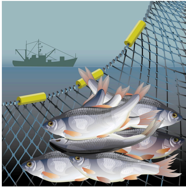
I GARNET: Norsk fiskeeksport er viktig for vårt forhold til EU og EØS.

På det juridiske området reiser avgrensningene av EØS-avtalens anvendelsesområde, og EFTA-domstolens praksis i tilknytning til bestemmelsene om dette, en rekke problemstillinger om reguleringsfrihet når det gjelder investeringer, arbeidskraft, tjenester og statsstøtte i fiskeriene og havbruksnæringen, og i miljørelaterte spørsmål. Drøftelsene viser at en NOREXIT ville medføre at det rettslige handlingsrommet formelt sett ville øket, men at norske eksportører fremdeles måtte ha forholdt seg til EUs standarder og konkurranserett. Der styrkeforholdet er skjevt, er det ikke åpenbart at økt selvråderett er noen fordel for den svakeste parten. Det kan derfor spørres hvor mye større det reelle handlingsrommet ville blitt. Fremstillingen viser også at EØS-retten er en viktig garantist for beskyttelse av miljøhensyn knyttet til havbruksnæringen. Med en NOREXIT kan det ikke utelukkes at miljøhensynene i større grad ville blitt veid mot andre hensyn, og dermed også måtte ha veket i tilfeller der EØS-retten i dag er til hinder for det. Analysene her bør være av interesse for alle som ønsker å reflektere rundt reguleringsfrihetens pris.