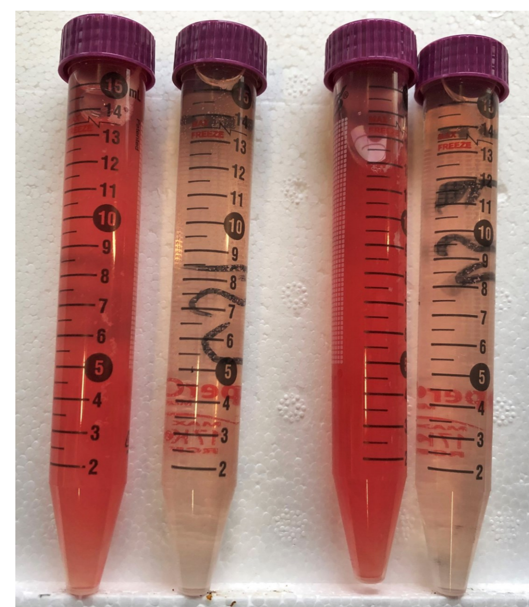
Figur 3: Vannprøver før og etter sentrifugering.