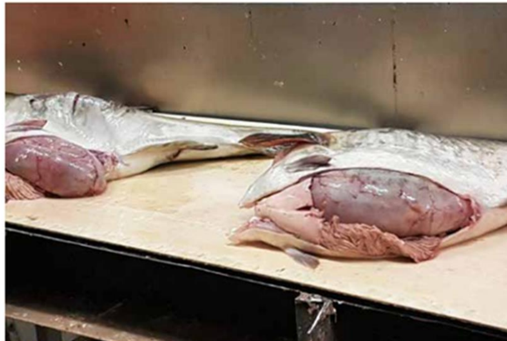
VELFYLT: Torsken som landes i Nord-Troms for tida bærer tydelig preg av den gode mattilgangen i området.