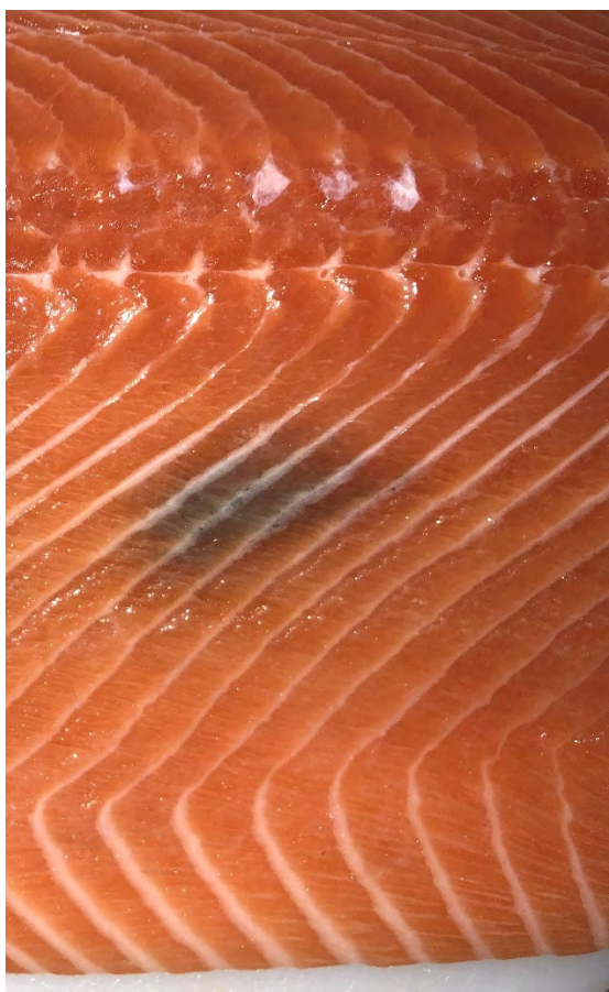
Typisk mørk flekk i filet av oppdrettslaks