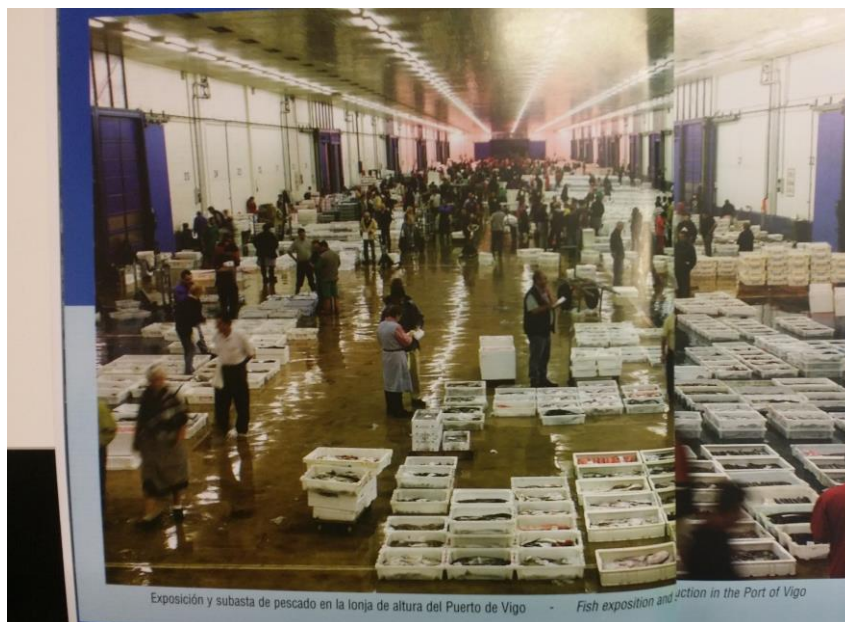
Figur 3 Fiskeauksjonshallen i Vigo havn, Galicia, Spania

Basert på at store mengder fersk fisk går gjennom dette systemet daglig, og at mye av fisken blir konsumert lokalt på restauranter, tyder det på at denne praksis ikke medfører nevneverdig risiko for matforgiftning fra patogene bakterier. Dersom dette hadde vært tilfelle, ville en relativt enkelt kunne følge produktet tilbake i den korte distribusjonskjeden for å identifisere hvor kontaminasjonen hadde skjedd. og Deretter ville en kunne endret rutiner for å redusere risikoen for smitte av sykdomsfremkallende bakterier ved for eksempel vask, beskyttelse av kasser under stabling, ikke sette kassene direkte på gulvet osv.