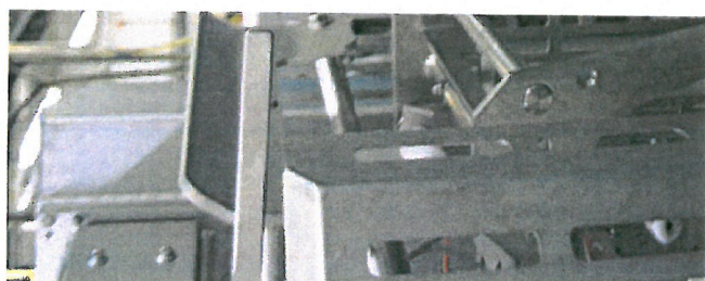
De ansatte hos Lerøy Norway Seafoods på Me