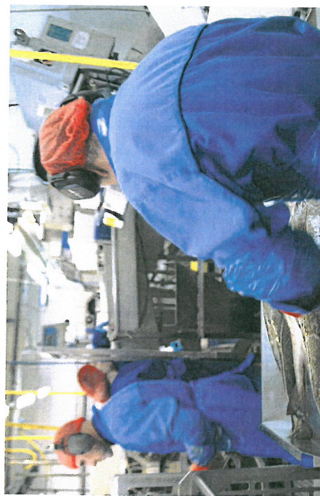
De ansatte på Melbu har sluppet på å bygge ut og reparere anlegget. De nye eterne i Lerøy-konsernet setter tungt på Melbu. Aller best synes det utenpå. Smart er de gamle byggene ut mot havet som blir bygget ut. Her bygger fabrikkene på Melbu. Bivingsanlegget i Fossum er i tillegg i sommer og går sin gang for