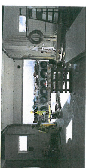
Sorland Entreprenør er i sving med å renovere katområdene.

– Vi har hatt et uke permitteringsordning, men nå er planen å utvide produksjonen på Melbu. Det er viktig å ha en god kommunikasjon og samarbeid mellom alle.