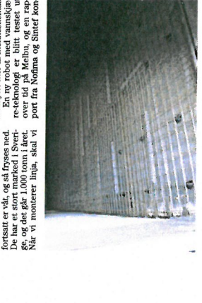
Råstoffrommet blir totalrenovert. Bare det er et solidt investering i anlegg på Melbu.