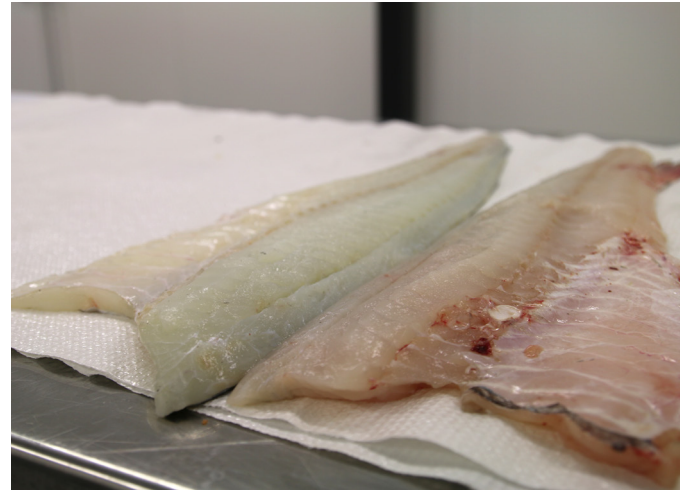
Hvit og rød filet.