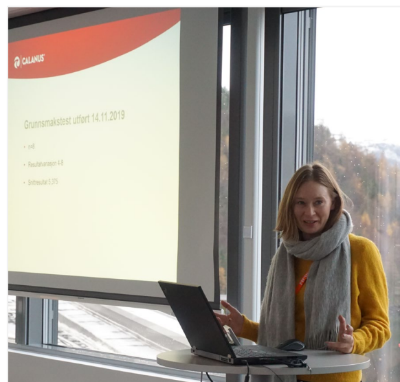
Figur 2 Illustrasjonsbilder over aktivitet under gjennomføring av sertifisering av panelledere