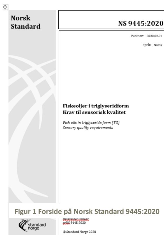
Figur 1 Forside på Norsk Standard 9445:2020

13. januar 2020 hadde komiteen siste koordineringsmøte der høringsuttalelsene ble vurdert før standarden ble publisert 1. februar i norsk versjon (Figur 1) og 1. mars 2020 i engelsk versjon.