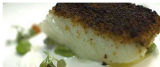
Una pieza de bacalao.

Sin embargo, cuando el producto ha sido cocinado, el mismo consumidor es perfectamente consciente de las diferencias en sabor , aroma y textura entre ambos tipos de bacalao. Esto pone de manifiesto la enorme importancia de que la mención "al punto de sal" o "desalado" acompañe al nombre comercial y sea claramente visible, facilitando una compra consciente por parte del consumidor.