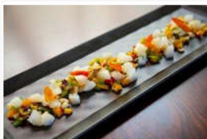
Creación culinaria con bacalao.

Pese a ser un pescado muy tradicional en la cocina nacional, actualmente muy pocos barcos con bandera española se dedican a extraerlo como especie principal. Según el último censo, publicado este año, cuatro buques españoles tienen cuota (de las asociaciones Agarba y Arbac ). Faenan en caladeros del Ártico, del Atlántico norte ( NAFO ) u otras aguas internacionales.