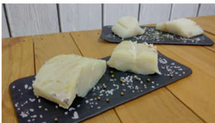
El proyecto de ANFACO informa al consumidor de las diferencias entre bacalao desalado y bacalao al punto de sal.

Anfaco evalúa las posibilidades de la biotecnología azul