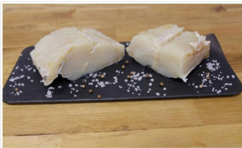
Bacalao desalado.

En el mercado español hay una gran variedad de productos del bacalao , pero el ciudadano desconoce las diferencias, según las industrias españolas, integradas en la patronal Anfaco-Cecopesca que han puesto en marcha una campaña precisamente para informar sobre dichas distinciones.