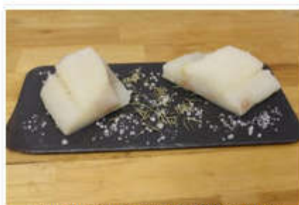
Bacalao al punto de sal.

Es el centro de la campaña del proyecto Saldicomm, impulsada por la Asociación de Fabricantes de Bacalao y Salazones (Anfabasa), asociada a Anfaco, y por el Consejo de Productos del Mar de Noruega. Desde el área de Tecnología de Anfaco, Rodrigo González Reboredo, explica a Efeagro que es habitual un “mal etiquetado” del bacalao, lo que lleva a no distinguir estos dos términos, algo que para el sector es como confundir el “jamón curado” con el “no curado”.