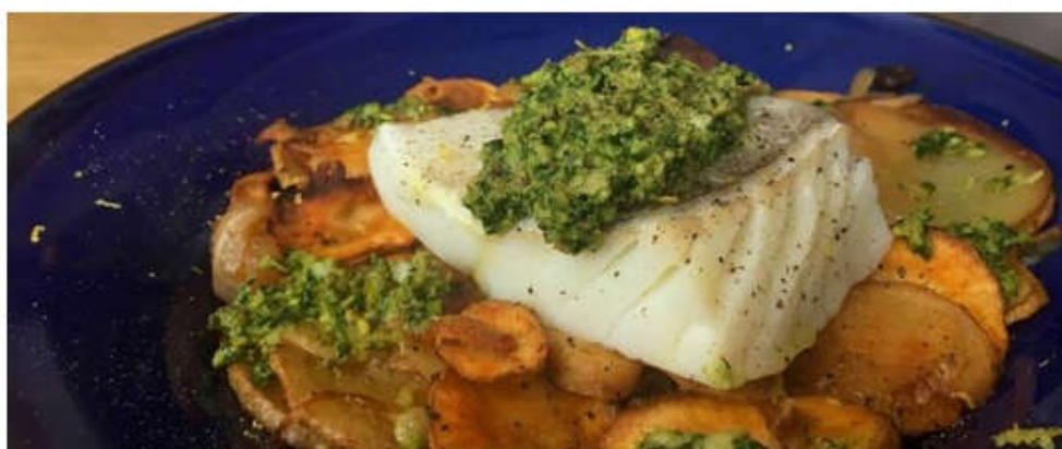
Unos lascos de bacalao cuejan en cualquier receta.

Podemos prepararlo sin pasar por el fuego, siempre que su consistencia sea firme, su olor, agradable y su color, uniforme