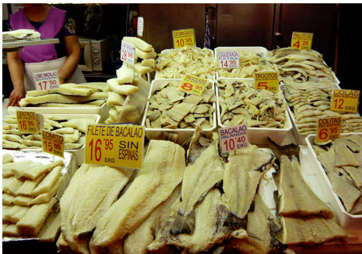
Puesto de venta de bacalao.

Al igual que para otras gamas de productos alimentarios, han aparecido formatos adaptados a los nuevos hábitos de vida; como es el caso del bacalao desalado y el bacalao al punto de sal. Estas dos denominaciones hacen referencia a dos productos que, aunque en apariencia puedan parecer similares, presentan diferencias notables en cuanto a su proceso de elaboración, su aroma, sabor, textura, composición y comportamiento en cocina.