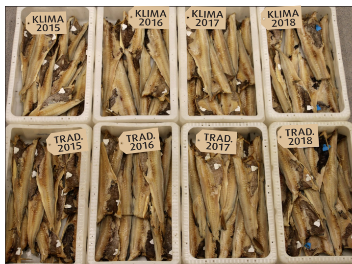
Bløytet fisk fra hver årgang og lager. Klimalager øverst.

Vanlige kvalitetsparametere på tørrfisk, så som mucoso og spalting, endret seg ikke i de vel tre årene fisken ble lagret.