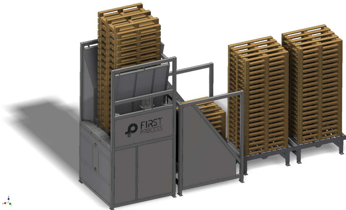
Figur.2 Illustrasjonsbilde av komplett oppsett pallesner

Det blir laget en video av utstyret utviklet i prosjektet. Utover dette er det ikke planlagt noe fakta ark, eller vitenskapelige artikler.