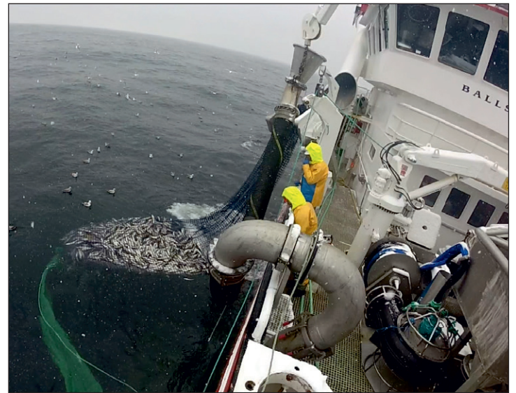
Klargjøring for pumping av hyse om bord.

(tradisjonelt levert) og kjølelageret videre fram til filetert ca. et døgn etter slakting, så gav dette et loinsutbytte på kun 16,3 %. Den resterende delen av fileten som ikke går til loins-produksjon, går i all hovedsak til lavpris bulkprodukt (blokk, farse). I dag er det minst 30 kroner i prisdifferanse mellom lavpris bulkprodukt (blokk) og høyverdiprodukt (loins). Mye filetspalting og bløt muskel var hovedårsaken til reduksjon i utbytte av høyverdiprodukt fra filet som ble skåret fra tradisjonelt levert hyse. Det må også nevnes at mye av den ferske hysen som leveres tradisjonelt til mottak på land, er direktesløyet rett etter fangst og lagret i RSW fram til levering. Under levering blir fisken pumpet fra RSW-tankene om bord og inn i kar på mottaksanlegg.