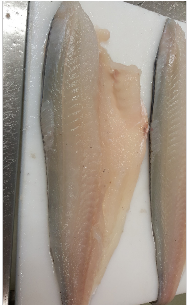
Fileter fra levendelevert hyse.

Det handler om å holde hysen levende fram til den blir kontrollert slaktet og etterfulgt av tidlig filetering (pre-rigor). Fisk utsettes for stor fysisk belastning under fangst, og melkesyre hopper opp i muskelen. Fisken presser derfor blod ut i muskelen for å fjerne melkesyren. Når fisken holdes levende om bord under gunstige betingelser, så begynner fisken å komme til hektene igjen. I FHF prosjektet «Ilandføring av levendelevert hyse» (FHF prosjekt nr. 901279) ble det gjennomført flere forsøk med å fange hyse og føre den levende til land for kontrollert utslakting og pre-rigor prosessering. Ved hysefiske med snurrevad fartøyet M/S Ballstadøy