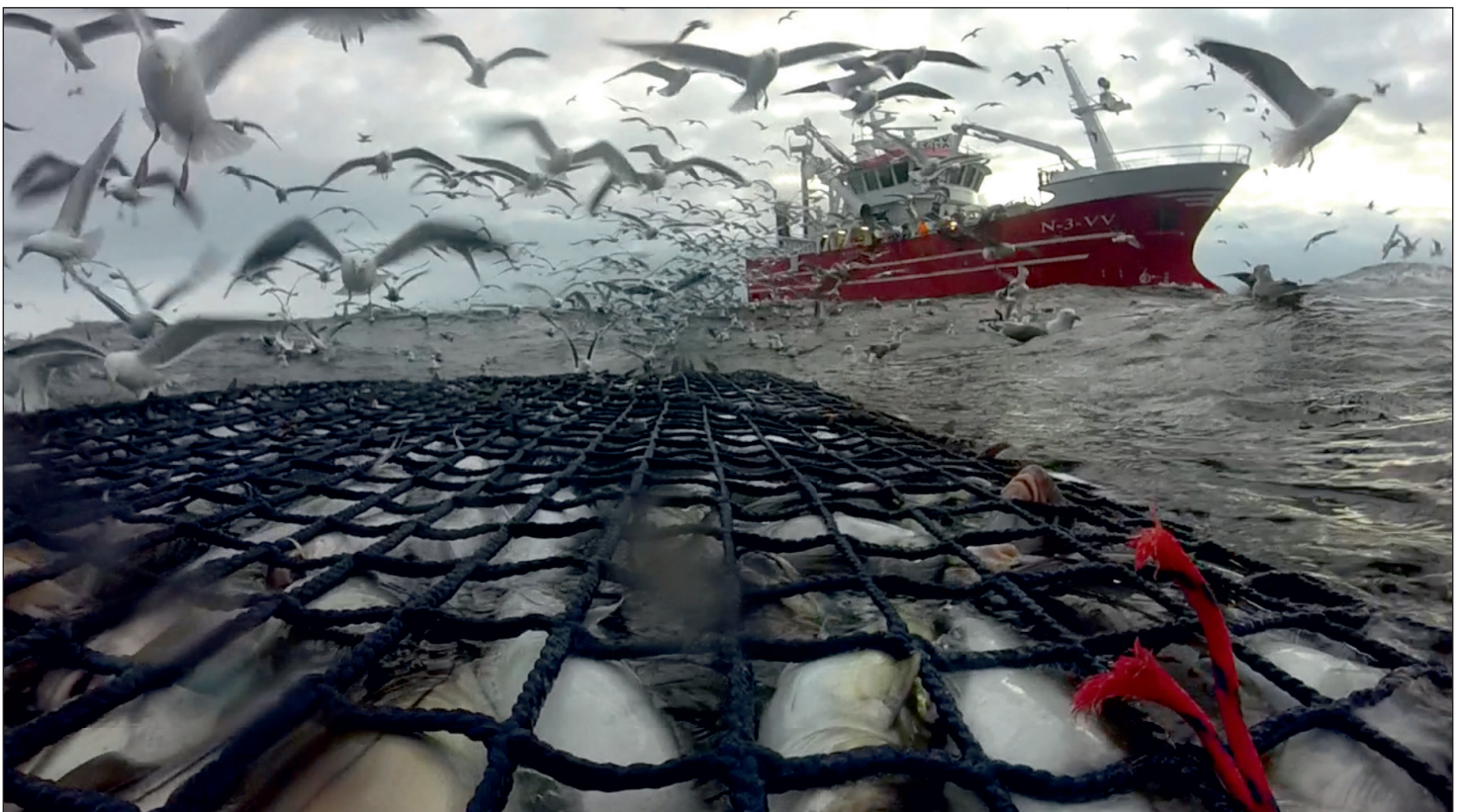
M/S Ballstadøy har deltatt i alle forsøkene som er gjennomført i prosjektet.

ofte til svært store enkelfangster (30-50 tonn). Mye fisk i snurrevadsekken kan påføre fisken stor belastning og klemskader under fangst og ombordtaking. Av kapasitetshensyn om bord er det også vanskelig å bløgge eller direktesløye store mengder fisk før den dør. Dette bidrar blant annet til dårlig blodtømming av fisken, spesielt når det er høye sjøtemperaturer og fangsten blir liggende lenge i snurrevadsekken før den tas om bord for slakting og kjøling. Hyse, som er utmattet før den dør, får også en hurtig og hard dødsstivhet. Under sløying og håndtering av hyse som er dødsstiv risikerer man å rive over bindevev i muskelen, og dette bidrar til bløt og spaltet filet.