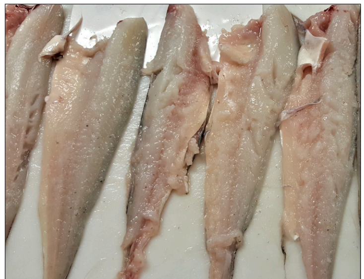
Fileter fra hyse som er tradisjonelt fangstet.