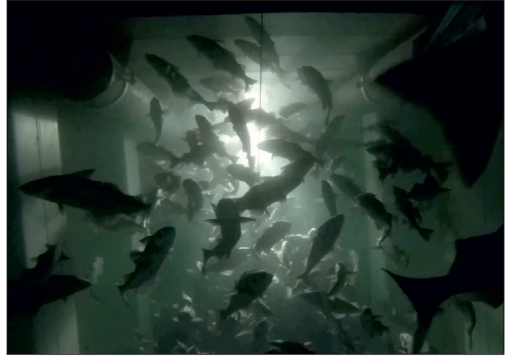
Levende hyse om bord i M/S Ballstadøy sine tanker.

Det ble også gjennomført produksjonsforsøk der man sammenlignet levendelevert hyse fra Ballstadøy, mot tradisjonell leveranse av hyse fra et annet fartøy. Ett døgn etter avlivning, sløyning og kjølelagring, ble hele lasten fra begge fartøyene kjørt gjennom produksjonslinjen til Båtsfjordbruket, før produksjons- og loinsutbytte ble regnet ut. Det var ikke forskjell i filetutbytte, som lå på ca. 44-45 % rett etter filetering. Utbyttet av høyverdiprodukt (loins) mellom gruppene, gav betydelige forskjeller. Levendelevert hyse som ble filetert ett døgn etter slakting og kjølelagring, gav et loins-utbytte på 48,5 %. For hyse som ble tradisjonelt handtert om bord på et annet fartøy, i kjølt resirkulert sjøvann (RSW) fram til levering,