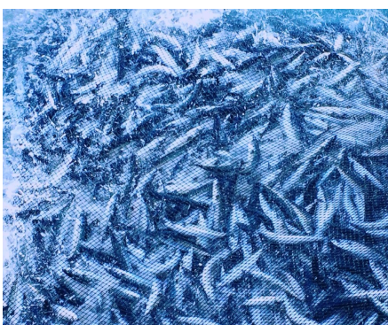
Fisken koker ved tørking av nota. Det skaper stress, og fisken dør ned raskere—som igjen kan gi redusert kvalitet. Dette bør unngås så mye som mulig.