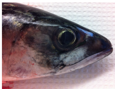
Makrell med synlig ytre skade med bloduttredelser i gjelleregionen. Denne fisken ville også vært med på å bidra til blod i silvannet, en indikasjon på for tøff behandling.