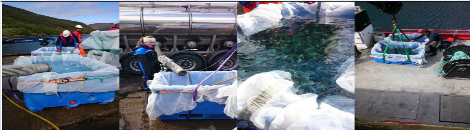
Lossing av rognkjeks fra transportbil til transportkar om bord på båt.