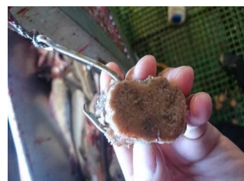
Ecobait agn etter 10 timer i Barentshavet

Ecobait agn har blitt svært mye testet, både på kyst og på autoline, og det har vært benyttet forskjellig testmetodikk i det praktiske linefiskeriet. En kjent metodikk er å gjøre sammenligningsserier på eksempelvis 50 eller 100 kroker med kunstig agn, mot det samme antall egnede kroker med naturlig agn. Videre bør serien gjentas flest mulig ganger. Ecobait har ved testing i all hovedsak sammenlignet fangstresultatet på Ecobait agn med det beste naturlige «all round» agnet, akkar. Dette fordi akkar er det beste naturlige agnet i fisket