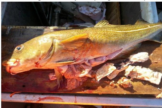
Torsk fanget i havteine med Ecobait agn i magen

Det er et stadig større fokus på at norsk fiskeri opptre på en ressurs- og miljøvennlig måte. Økt bruk av line og teine som fangstformer er en ønsket utvikling både av miljøhensyn, og med tanke på økt verdiskaping på grunn av høy kvalitet på fanget råstoff. Linenæringen benytter i dag menneskemat som agn (akkar, saury, sild og makrell). Det er et økende fokus på at alt fiskeri skal være bærekraftig og at ressursene i havet utnyttes på en optimal måte. Skal linefanget fisk oppnå gode priser på sikt må fisket ha en langsiktig høy miljøstatus, og det må arbeides kontinuerlig med best mulig ressursutnyttelse. Det er svært høye priser på naturlig agn og dette truer lønnsomheten i norsk linefiske.