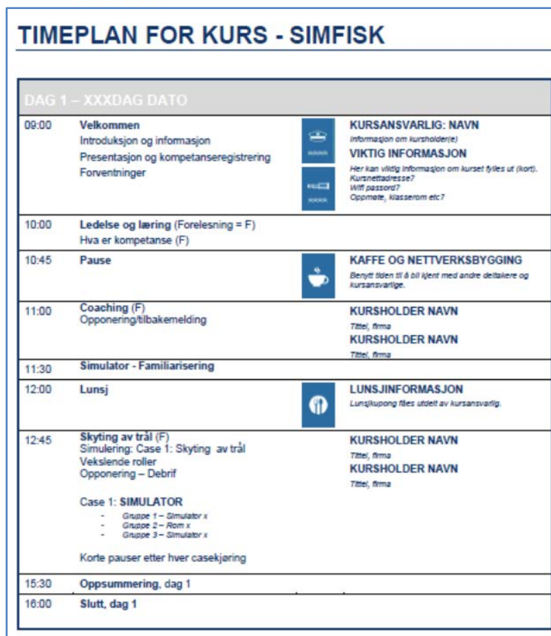
Figur 3: Oversikt over innholdet i trålerkursets dag 1, utarbeidet av NTNU Ålesund.