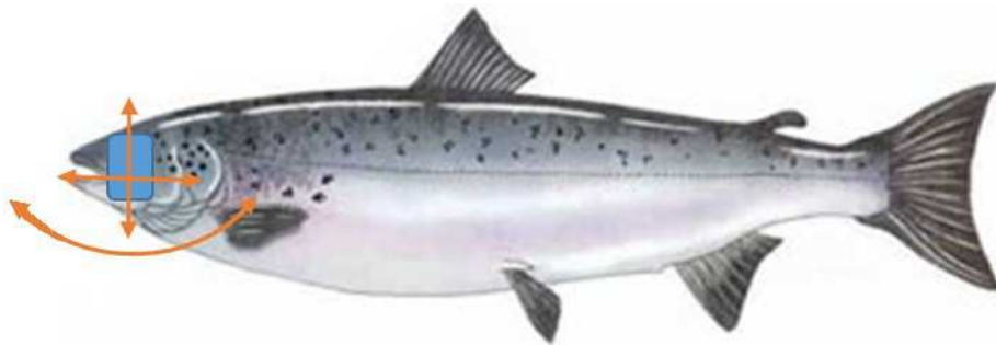
Figur 2 Illustrasjon som viser de ulike plan som den håndholdte skanneren ble beveget i under irisskanningen.