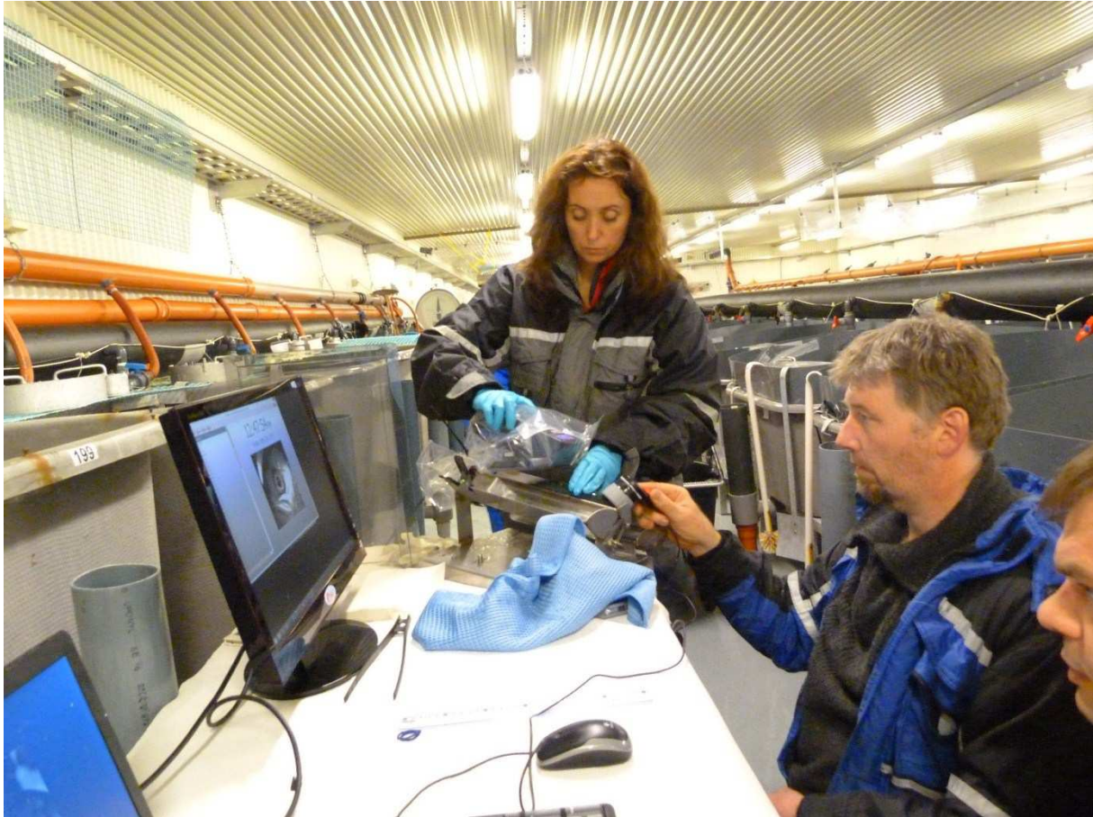
Figur 1 Bilde som viser samtidig lesing av PIT-tag og irisskanning. Laksen ligger i et stativ (slede) med åpning for hodet/øyet.