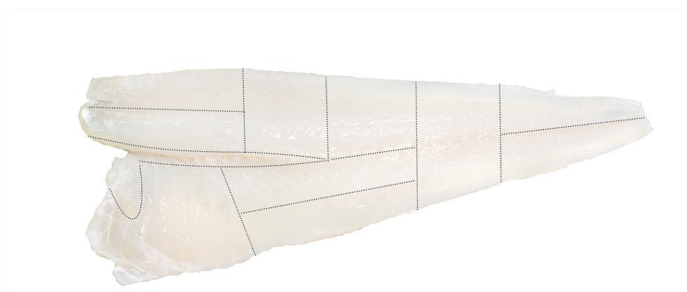
Mulige kuttemønstre for fileter i Valka X Ray Guided Cutting Machine.

Valka X-ray Guided Cutting Machine kutter alle typer fileter, med eller uten skinn, primært for å fjerne tykkfiskbein (pin bone), men også for porsjonering av fileten. Maskinen detekterer bein i fileten med stor nøyaktighet, ned til 0,2 mm beintykkelse, vha. nyutviklet røntgenteknologi. Basert på dette blir bein fjernet ved vannstråleskjæring i et rent presist kutt ved trykk på 3.800 bar. Maskinen fungerer i dag fint på land, men er tidligere ikke brukt om bord i båter, som er fokus i dette prosjektet. Valka sin kutter kan i tillegg porsjonere fileten i flere biter/porsjoner, som gir ytterligere muligheter for økt verdiskaping og produktdifferensiering. Eksempler på slik differensiering av produktspekteret er loins og sporstykker med eksakt vekt.