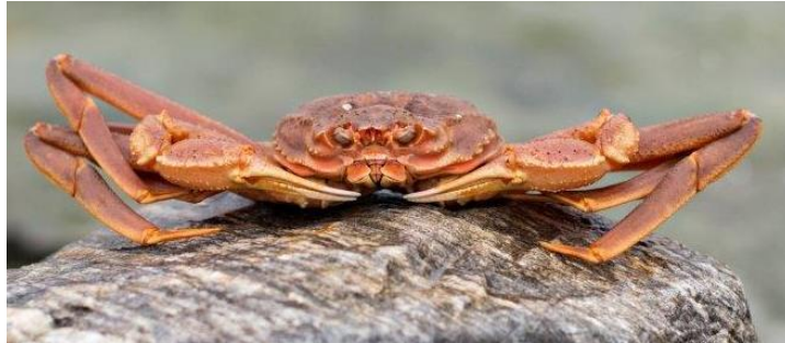
Bilde 1 Snøkrabbe ( Chionoecetes opilio ).

Snøkrabbe ( Chionoecetes opilio ) finnes på mellom 60 og 280 meters dyp på bløt- og eller sandholdig bunn innenfor et temperaturområde på -1 og 7 °C i sitt naturlige utbredelsesområde (Hardy et al., 1994; 2000) (Bilde 1). Hannen utgjør den kommersielle delen av bestanden og kan bli opptil 15 år gammel (maks skallbredde 16,5cm). På grunn av naturlig nedbryting av skallet er hannkrabben tilgjengelig for fiske i kun 3 til 4 år etter siste skallskifte (Dutil et al., 2009).