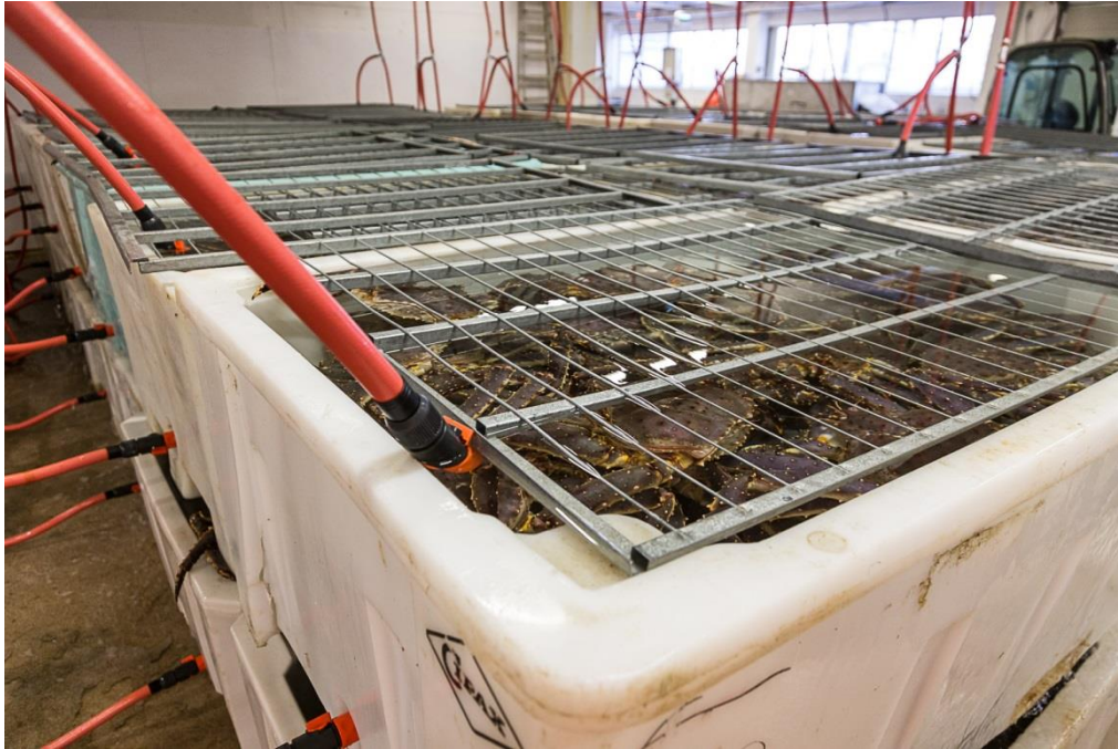
Bilde 2 Tradisjonelle plastkar brukt til levendelagring av kongekrabbe.

For kongekrabbe er det i dag vanlig med individtettheter på ca. 150 kg kongekrabbe pr. m 3 under levende mellomagring i tradisjonelle 700 L plastkar (Bilde 2). Grunnet mangel på kunnskap på optimale individtetthet hos snøkrabbe ble det tatt utgangspunkt i tilsvarende tettheter i det første forsøket med snøkrabbe (forsøk I).