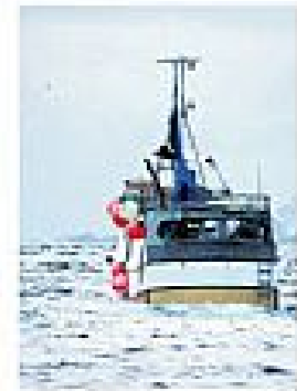
Ny høringsrunde om sjarkforskriften Side 8