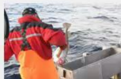
Juksa og dorgefiske