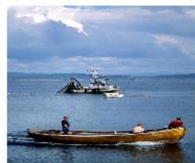
REGELVERK / SJEKKLISTER