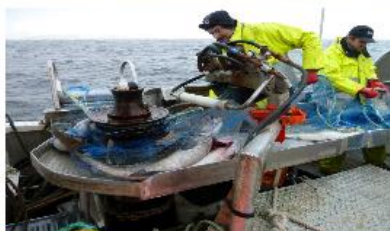
RISIKOVURDERING - FISKRISK