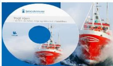
BESTILL DVD "TRYGT HJEM"