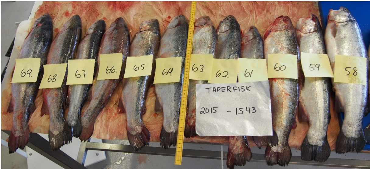
Bilete 5. Regnbogaure frå utkastkaret ved uttak i Nord-Noreg i august 2015. I fisk nr. 62 og nr. 67 vart det funne høvesvis 2 og 3 kjønnsmodne eksemplar av den ikkje-zoonotiske kveistypen Hysterothylacium aduncum .