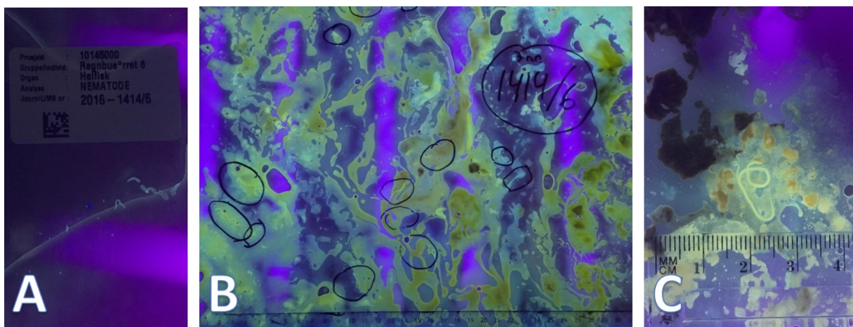
Bilete 3. Merking av plastposar til pressing (A). Innvolgar av regnbogeare etter pressing, sett under 366 nm UV-lys (B). Nematodar i innvolane til taparfisk av regnbogeare (C).

Heile fisken, dvs. både filet og innvolgar vart undersøkte og til analysane for mogleg førekomst av kveis vart den tidlegare nemnte UV-pressmetoden nytta. Metoden går ut på å flatpresse heile fisken (filet og bukklapp) i tillegg til innvolane, i separate gjennomsiktige plastposar, ved hjelp av ei hydraulisk presse med omlag 10 tonn trykk/60x60 cm (Bilete 3 B). Etter djupfrysing og påfølgjande tining av posane vert desse undersøkte makroskopisk for nematodar under ei 366 nm UV-lyskjelde. Dette fordi anisakide nematodar som har vore frosne fluoriserer under UV-lys ved ovannemnte bølgjelengd, avhengig av type/art og individuell storleik (Bilete 3 B og C).