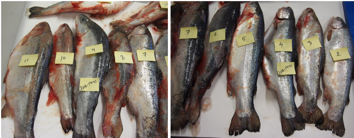
Bilete 6. Regnbogaure frå utkastkaret ved uttak i Nord-Noreg i september 2016. I fisk nr. 6 vart det funne eit eksemplar av Anisakis simplex i fileten, samt 27 kjønnsmodne eksemplar av den ikkje-zoonotiske kveistypen Hysterothylacium aduncum . I fisk nr. 8 vart det funne 3 stk. A. simplex i fileten.