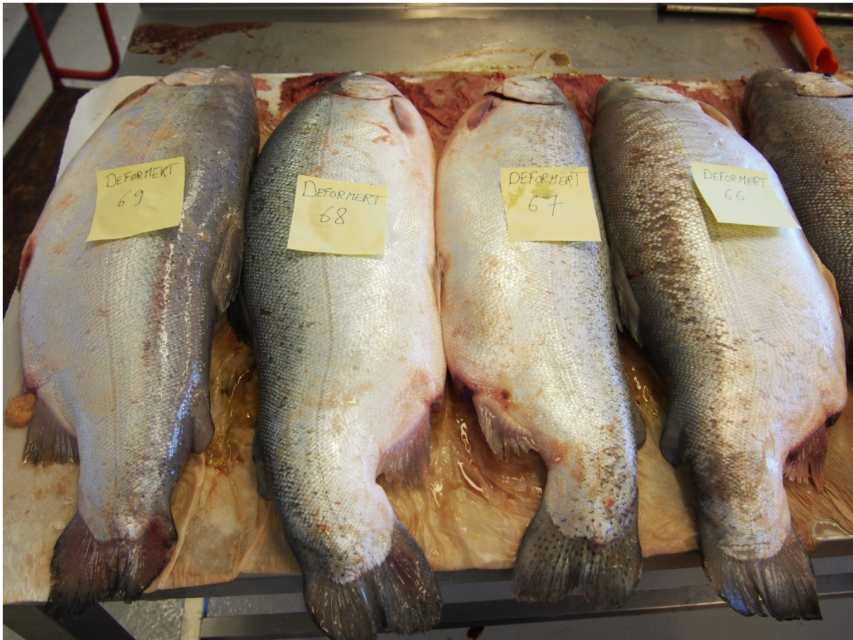
Bilete 2. Regnbogaure frå uttaket i Nord-Noreg i mai 2016, fisk som ut i frå storleik (gjennomsnittleg vekt 4,5 kg og K -faktor 2,29) ikkje er klassifisert som typiske taparar, men som har tydleg deformert fasong og difor vart teke ut.

For å ivareta kravet om fagleg sjølvstende og nøytralitet vart det betalt marknadspris for regnbogaure frå transportbandet, men ikkje noko for utkastfisken. I samband med dei fleste uttaka fekk NIFES kopi av slakteprotokollen med viktig informasjon om produksjonslokaliteten og –prosessen, som m.a. alder på fisken, fôringsregime og sjukdomshistorie/behandling inkludert avlusing og mogleg bruk av leppefisk. I tillegg kunne vi då også sikre sporing av regnbogauren frå slakteria tilbake til dei aktuelle anlegga og merdane. Informasjon om bruk av leppefisk vart likevel ikkje gjort tilgjengeleg frå alle anlegga (sjå Tabell 2). Rett etter prøvetaking vart regnbogauren frakta som kjøle- eller frysevare med båt (Hurtigruten/Norlines) eller bil til NIFES og lagra frosen ( -30^{\circ}\text{C} ) fram til opparbeiding og analyse for kveis. Djupfrysing av fisken så raskt som mogleg etter uttak var ein viktig føresetnad for å unngå eventuelle problem med tyding av resultat, særleg knytt til spørsmålet rundt eventuell post-mortem vandring, dersom funn av Anisakis i filet skulle bli gjort. I forkant av analysane vart det teke bileter av all fisken, i grupper à 5-10 stk, der kvar enkelt fisk var individuelt merkt slik at seinare oppfølging i høve til utsjånad og kategorisering (typisk taparfisk eller deformert/skada aure etc.) var mogleg. Etter fotografering vart kvar fisk vege (g) og målt (lengde i mm).