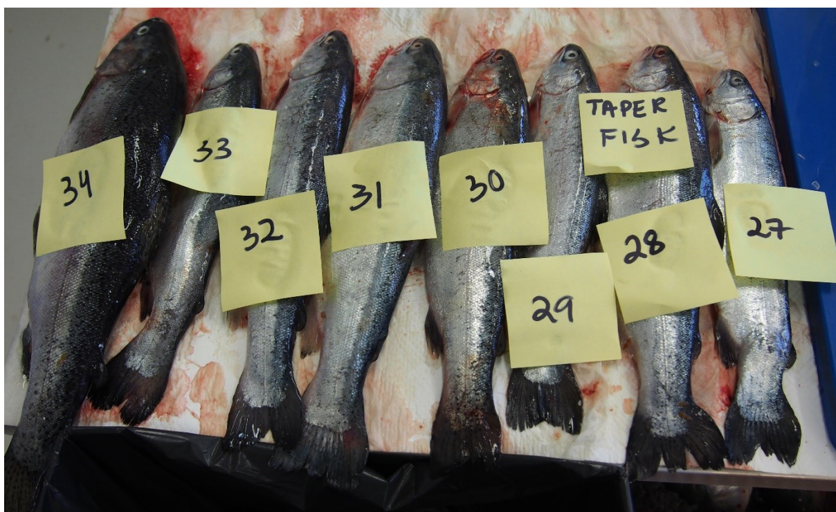
Bilete 4. Regnbogaure frå utkastkaret ved uttak på Vestlandet i juli 2016. Fisk nr. 29 (typisk taparfisk; vekt 340 g, K -faktor 0,99) var infisert med eit eksemplar av den ikkje-zoonotiske kveistypen Hysterothylacium aduncum

Det vart funne kveis i fem (5) taparfisk frå høvesvis to lokalitetar i Nord-Noreg og ein lokalitet på Vestlandet. I ein fisk (Bilete 4) frå vestlandet vart det funne eit (1) kjønnsmodent eksemplar av den ikkje-zoonotiske kveistypen Hysterothylacium aduncum , medan det i to fisk (Bilete 5) frå same lokaliteten i Nord-Noreg vart funne høvesvis to (2) og tre (3) kjønnsmodne H. aduncum . Frå ein lokalitet i Nord-Noreg vart det påvist høvesvis ein (1) og tre (3) Anisakis simplex i fileten til to taparfisk (Bilete 6). I innvolane til auren med ein (1) påvist A. simplex vart det også funne 27 kjønnsmodne H. aduncum . Bilete 7 viser eit eksemplar av kjønnsmoden H. aduncum sett under UV-lys, påvist i taparfisk (fisk nr. 6) etter uttak i Nord-Noreg i september 2016. Alle dei fem infiserte fiskane vart eintydig identifisert som taparfisk og skilde seg tydeleg frå slaktefisken. På Vestlandet vart funna gjort om sommaren, medan i Nord-Noreg funna var gjort om hausten, altså i den perioden med størst biologisk aktivitet og produksjon i sjøen. I Nord-Noreg var det ikkje nytta reinsefisk, medan ved lokaliteten på Vestlandet var det brukt oppdretta rognkjeks og villfanga bergnebb og grøngylte til avlusing.