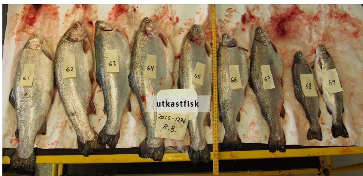
Bilete 1. Regnbogaure teke frå utkastkaret ved eit av uttaka på Vestlandet i august 2015. Her kan ein tydeleg sjå at fisk 68 og fisk 69 har karakteristisk taparstorleik, medan dei andre fiskane vart sortert ut av andre årsaker. Målt lengde var 28,5-54.0 cm og med stor variasjon i K-faktor (1,09-2,71).

Regnbogaure vart plukka frå transportbandet etter spyling og ved første utsortering av fisk med tydelege kvalitetslyter, men før bløding. Det vart også plukka fisk frå utkastkaret, som i mengd varierte mellom uttak, frå der det ved enkelte uttak ikkje var nokon fisk i utkastkaret og til om lag 20 % av totalprøven. No var det slik at ikkje all regnbogaure som var teke frå utkastkaret var typiske taparfisk, men også fisk som av ulike årsaker vart sortert ut tidleg i slaktefasen. Bilete 1 viser regnbogaure frå utkastkaret ved eit av uttaka på Vestlandet i august 2015, der fisk 68 og fisk 69 har karakteristisk taparstorleik, medan dei andre fiskane vart sortert ut av andre årsaker.