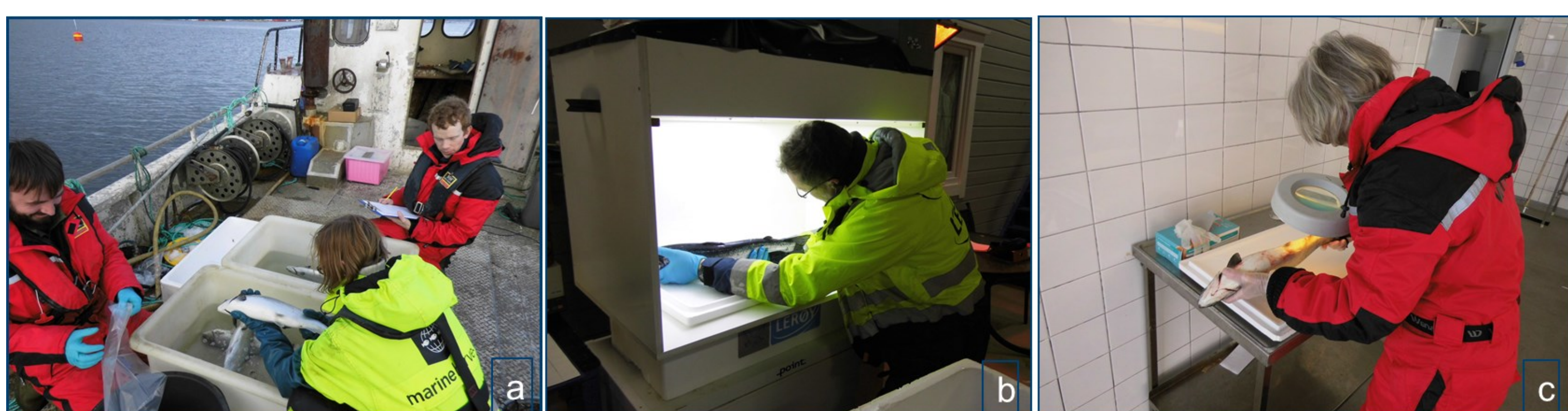
Figur 1. a) Standard telling på båt b) telling i lyskasse c) telling under lupelampe

Mattillsynet og næringen selv har presisert at all gjenværende lus i bedøvelseskaret skal rapporteres. I veilederen «Telling av lus» på lusedata.no er det presisert at lus i bedøvelseskaret skal være med i beregningen av antall lus per fisk. For å verifisere hvor stor andel lus som faller av under bedøvelse ble derfor antall lus i karet registrert under noen av tellingene. Vi vil her fokusere på viktigheten av å telle lus i bedøvelseskaret.