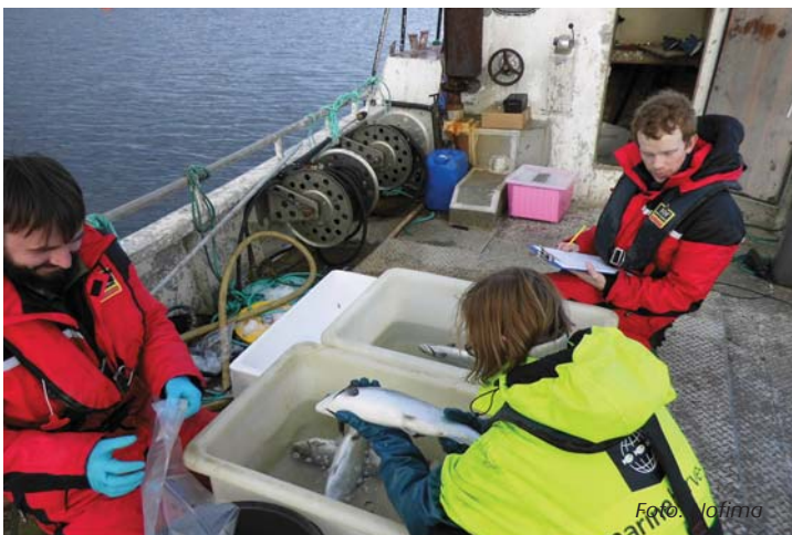
Figur 1. Standard telling av lus på båt.

Lus på samme fisk fra tre merder på tre lokaliteter ble talt på tre ulike måter hver 14. dag over en periode på 10-16 uker i perioden februar-april 2015. Fisken ble avlivet med overdose bedøvelse før første telling på båten. Her vil vi fokusere på viktigheten av å registrere og rapportere lus som faller av fisken i bedøvelseskaret.