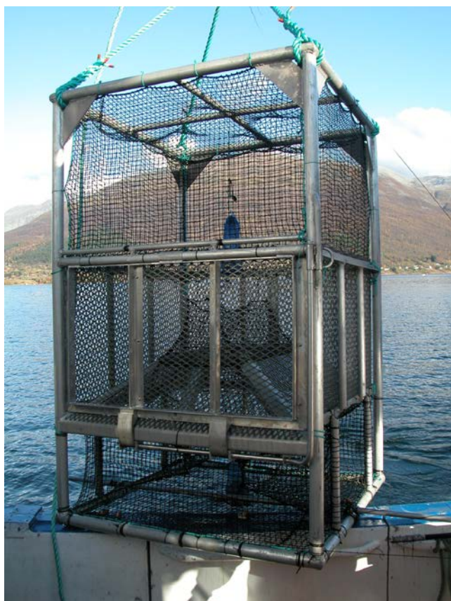
Figur 1. Lofotteine med underkammer.