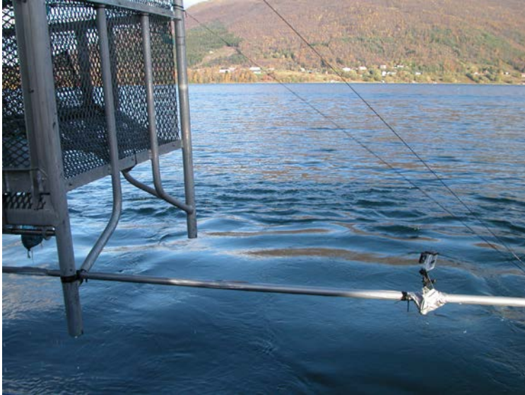
Figur 2. Lofotteine uten underkammer og med GoPro-kamera for atferdsstudier.