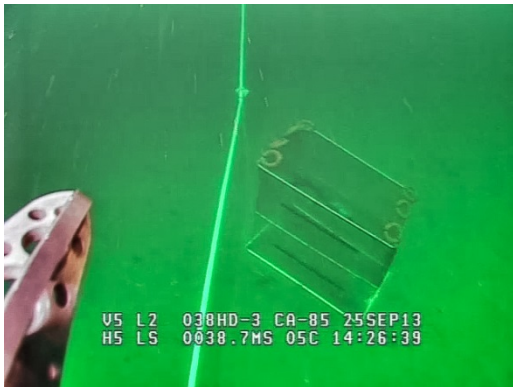
Figur 3. Eksempel på ei fløytet teine som var i ubalanse og stod på skrå ned mot bunnen.