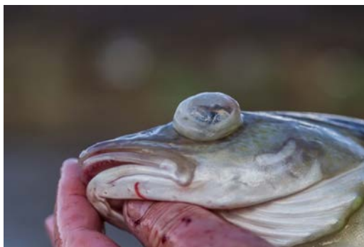
Figur 4. Torsk med utspilte gjellelokk, åpen munn og gassfylte øyne.