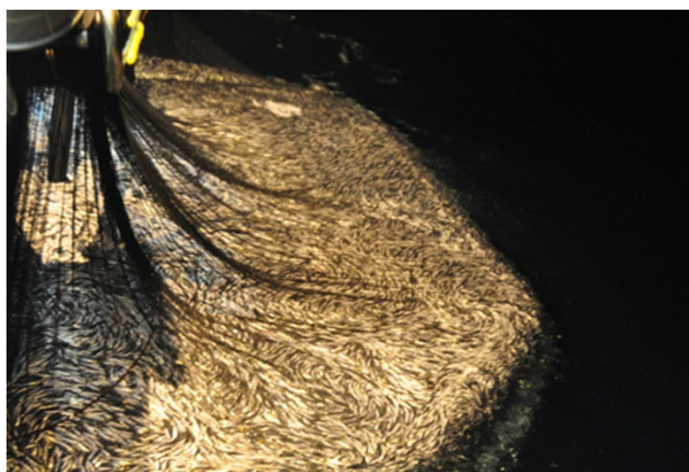
Figur 1: Sild i not.