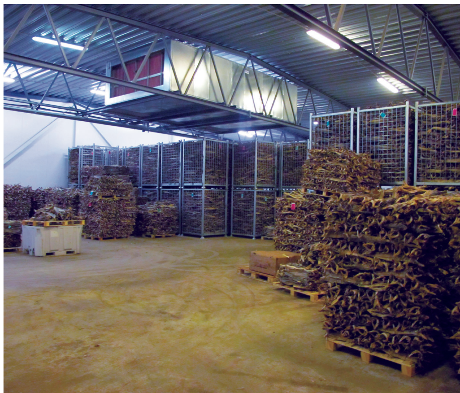
Pilotanlegget for klimastyrt lagring av tørrfisk som er etablert på Værøy.

Målet for dette prosjektet har derfor vært å utvikle og sikre nye lagringsformer slik at tørrfiskbransjen kan gå over til lagring i mer kontrollerte former. Dette vil sikre jevn, god og forutsigbar kvalitet på tørrfisken, i tillegg til å redusere vekttap under lagring. På denne måten kan næringen oppnå bedre kvalitet og en bedre pris for produktet, samtidig som skader og tap på grunn av uheldig lagring minimeres. Dette kan gi et mer forutsigbart produkt og gir bedre kontroll på kvaliteten. Dette gjør at en takler bedre forskjeller i råstoffet og tilpasser produktet lettere til ulike markeder.