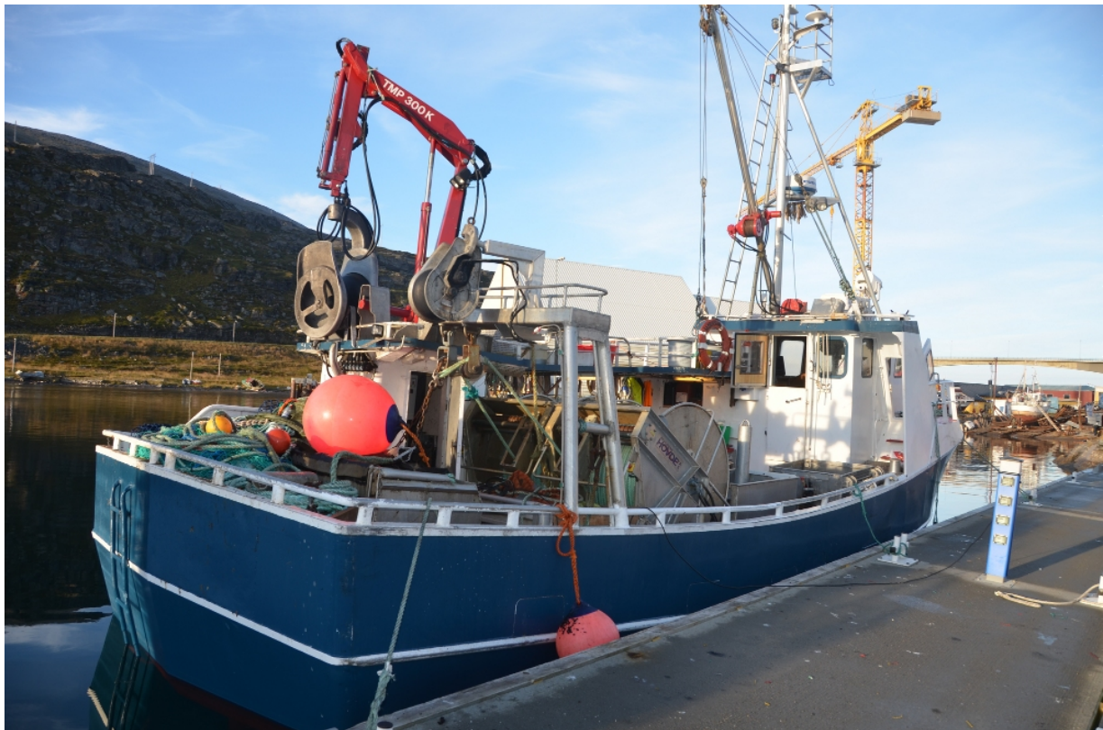
Bilde 1. M/S "Hornsund" ved kai i Havøysund. Legg merke til to kraftblokker. Den ene brukes til haling av not, den andre til legging av grunntelne med "skjørt", "sabb" og kjetting.