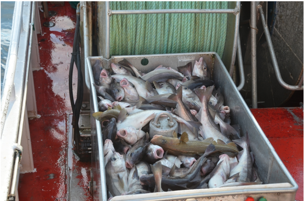
Bilde 3. Blandingsfangst av torsk og hyse. Den nedskalerte kvadratmaskeposen syntes å sortere godt, og der var knapt fisk under minstemålet i fangstene.