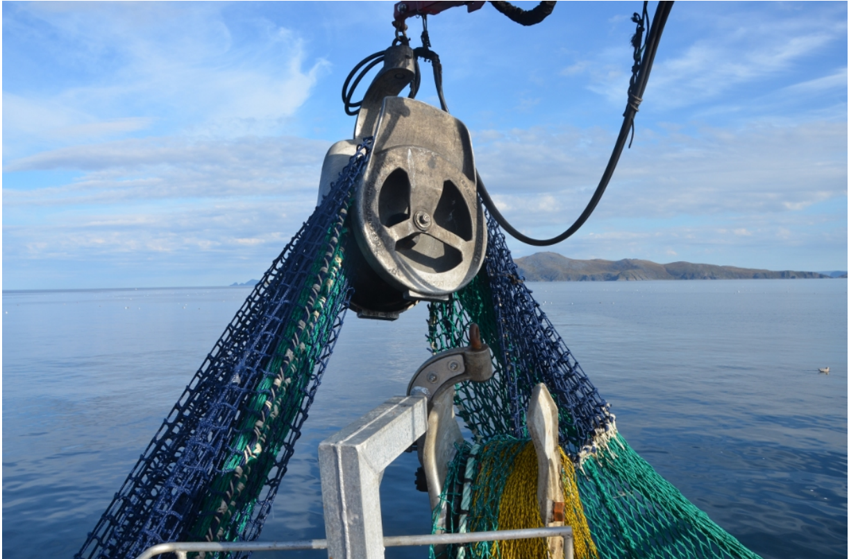
Bilde 2. Nedskalert kvadratmaskepose tas lett inn gjennom kraftblokk. Det er god plass for posen i blokken.