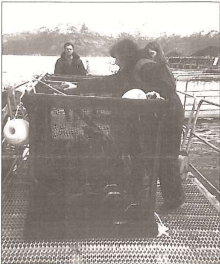
Fire bur ble senket ned på forskjellig dybde for å teste overlevelsevnen til to arter leppefisk. Forsøket ble utført ved Mowi-anlegget i Åkre, og viser gode resultater for bergnebb.

Vinterlagring 4 bur – Åkre Hardangerfjorden