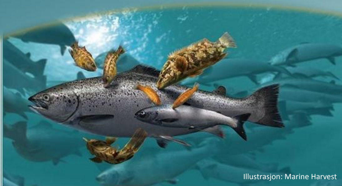
Illustrasjon: Marine Harvest