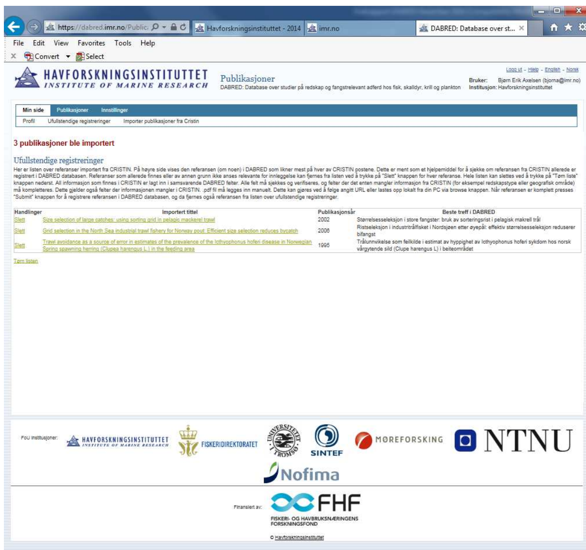
Figur 1. Eksempel brukergrensesnitt. Arbeidsliste under «Min side» etter import av .ris fil fra Cristin.

Cristin (typisk på forfatternavn og/ eller oppgitte nøkkelord) og eksporterer filen med bibliografi data til en tekstfil i .ris format som importeres i DABRED. Da DABRED innehar mer grupperingsinformasjon enn Cristin (som eksempelvis redskapstype, havområde osv) lagres alle tilgjengelige data fra Cristin i en midlertidig arbeidsliste kalt «Ufullstendige registreringer». Arbeidslisten blir liggende på «Min side» i DABRED hos brukeren som importerte listen. Alle Cristin poster som ikke omfattes av DABRED (foredrag, powerpoint presentasjoner m.v.) blir automatisk filtrert vekk. Bruker kan da når som helst gå inn på «Min side», hente frem arbeidslisten og klikke seg gjennom hver enkelt rapport i DABRED. DABRED foretar et automatisk søk i databasen som finner beste treff for rapporter registrert i databasen på samme år slik at en lett kan sjekke om rapporten allerede er registrert (eksempelvis av en medforfatter på en annen FoU institusjon). Rapporter i arbeidslisten som enten alt er registrert, eller som av annen grunn ikke er aktuell (begrensede muligheter til å avgrense søk i Cristin) kan lett fjernes fra listen ved å klikke på «Slett» i venstremargen (Figur 1).