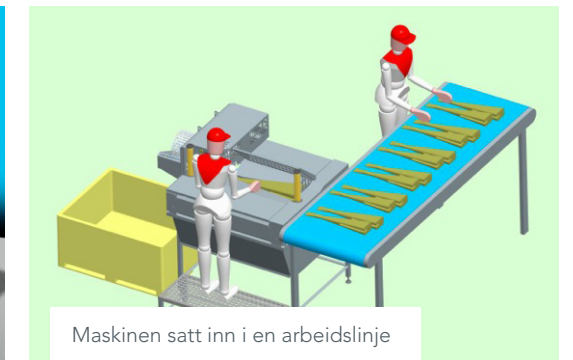
Maskinen satt inn i en arbeidslinje