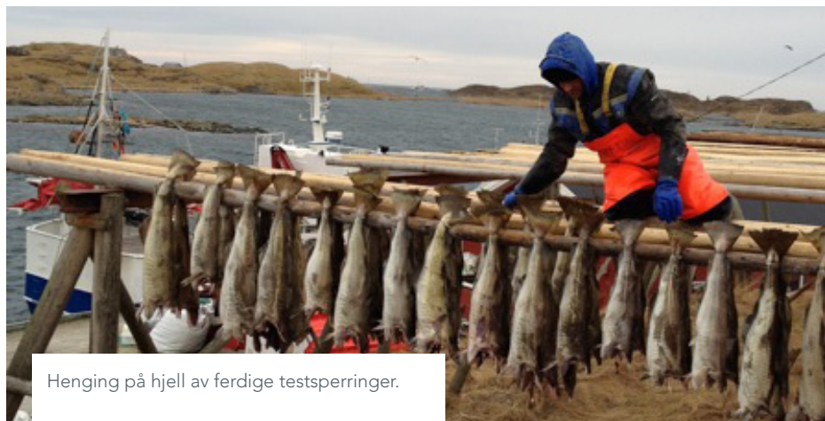
Henging på hjell av ferdige testsperringer.