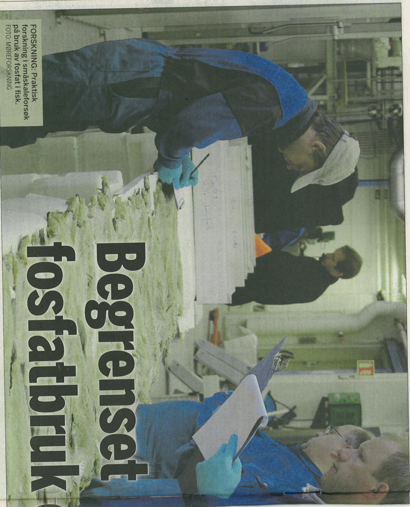
FORSKNING: Praktisk forskning i småskaleforsøk på bruk av fosfat i fisk.