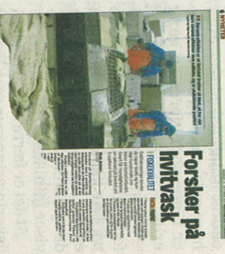
Forsker på hvittrask