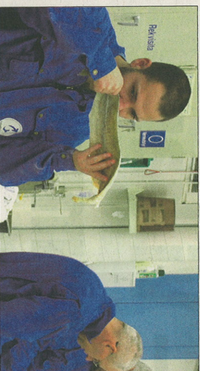
FOSFATFORSKNING: Møreforskning Marin dokumenterer fosfats virkning som hjelpstoff eller tilleggstoff i fisk.