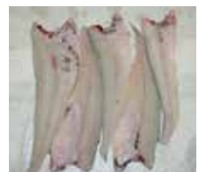
Bløgget umiddelbart etter opptak