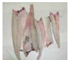
Direktesløyd etter 30min