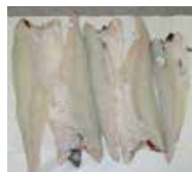
Bløgget 3 timer etter opptak