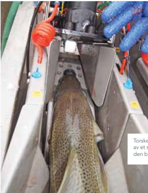
Torsken føres inn i maskinen og bedøves av et stempel fra oversiden samtidig som den bløgges fra undersiden.

Til de neste forsøkene om bord på M/K Bernt Oskar i 2012 ble det derfor foretatt justeringer av kniv, og laget nytt «inngangsparti» til maskinen tilpasset torskens hodefasong. I det neste forsøket så man at nye kniver og nytt inngangsparti ikke harmonerte og i det tredje og siste forsøket gikk man derfor tilbake til originalknivene, som man opplevde at maskinen traff presist på både stor og liten torsk.