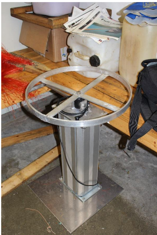
Figur 5. Stampholder med heve/senkefunksjon.