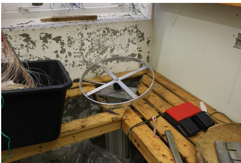
Figur 6. Montert stampholder, fotpedal sees på benken ved siden av.