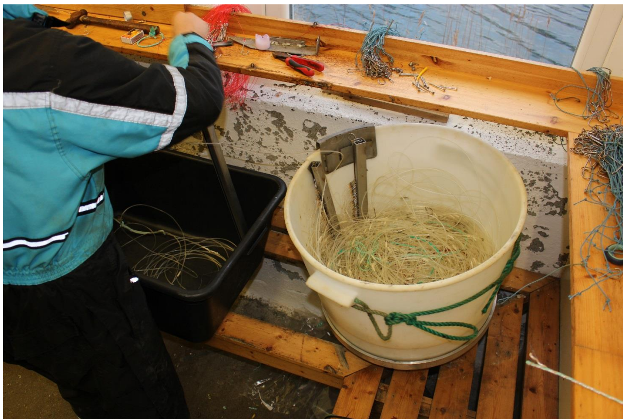
Figur 4. Halt stamp med korte magasiner og magasinholder. På dette bildet egnes ikke lina, men klargjøres for setting gjennom egnetrakt.