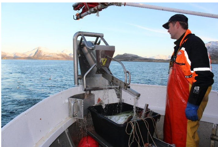
Figur 8. Setting av klavet monofilamentline gjennom egnetrakt.

Automatisert egning av monofilament er en utfordring, mye grunnet spennet og stivheten i monofilament versus tauline. Ulike metoder for kombinasjon av egnetrakt med tilfeldig egning og klavet monofilament ble forsøkt i prosjektet. Her ble det gjort for lite utprøving til å trekke konklusjoner, men selv om de innledende testene ikke var tilfredsstillende, tyder det på at det kan være et potensial for denne metodikken.