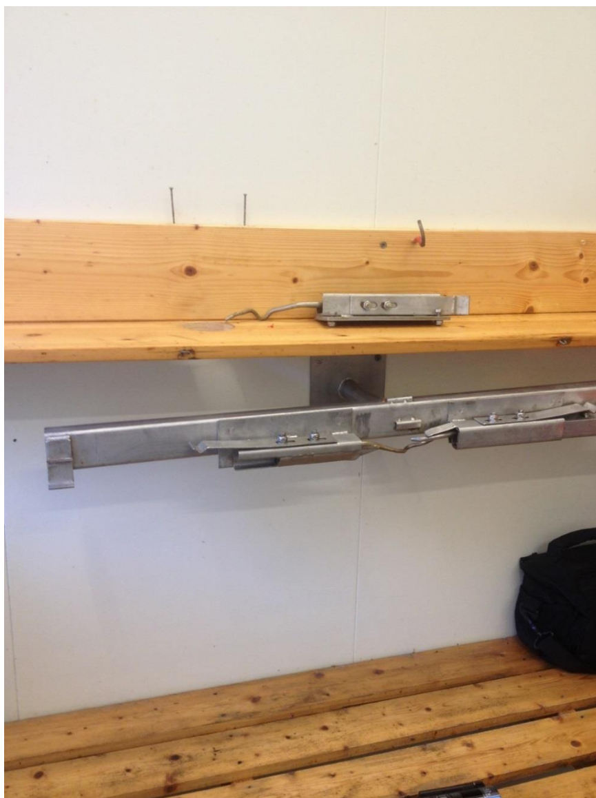
Figur 3. Original egnestasjon med veggmontert magasinholder.