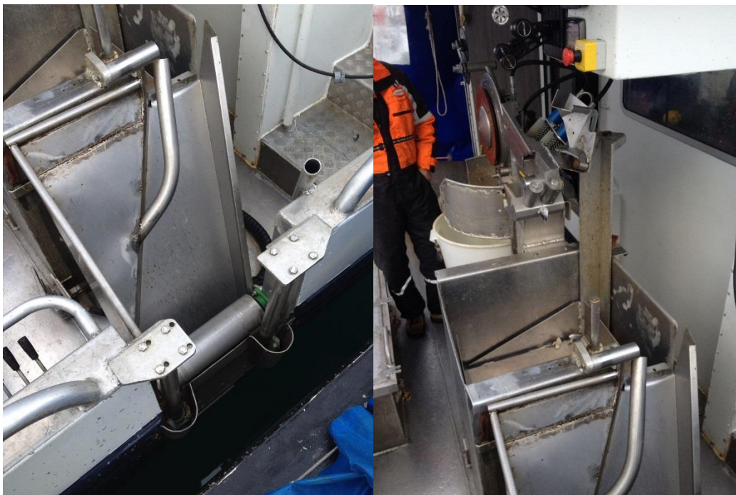
Figur 7. Mindre knekk ved senking av rekkerull, samt stabil føring av line mellom vannet og kveiler begrenser snur og berger fisk.

De tiltakene som ble gjennomført her gikk på styring av line på rekkerullen. Rekkerullen ble senket, det ble montert "andøvere", kombinert med at rekkerullen ble senket for å redusere tap av fisk mellom rekkerull og vannflate.