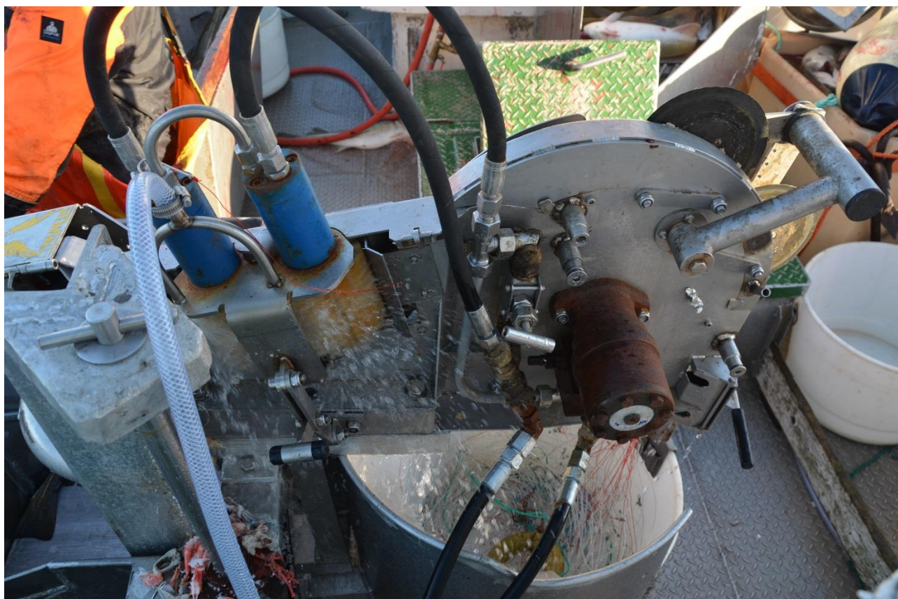
Figur 1. Haler med to børster for agnrensing.

Løsningen i dette tilfellet ble å repetere prosessen ved å montere en ekstra børste med tilpasset trykk, se Figur 1. Dette tiltaket førte til bedre rensing av krok samtidig som tap av krok i børster ble redusert. Bedre rensket krok fører igjen til bedre oppfangning på magasin og redusert bøtetid. Det magnetiske oppfangningssystemet ble utvidet med bedre magnetteknologi og større oppfangingsområde, se Figur 2.