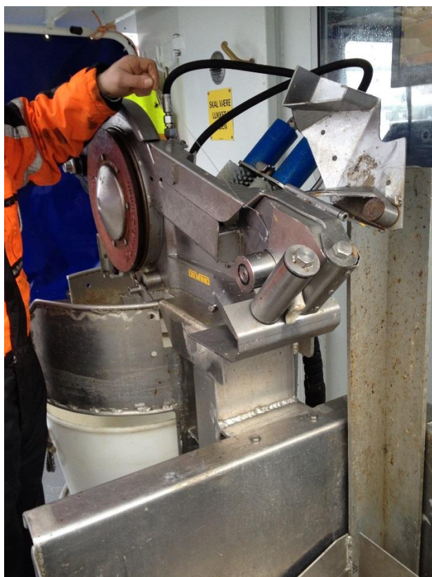
Figur 2. Magnetseksjonen er utvidet og forbedret. Her starter oppfangning.