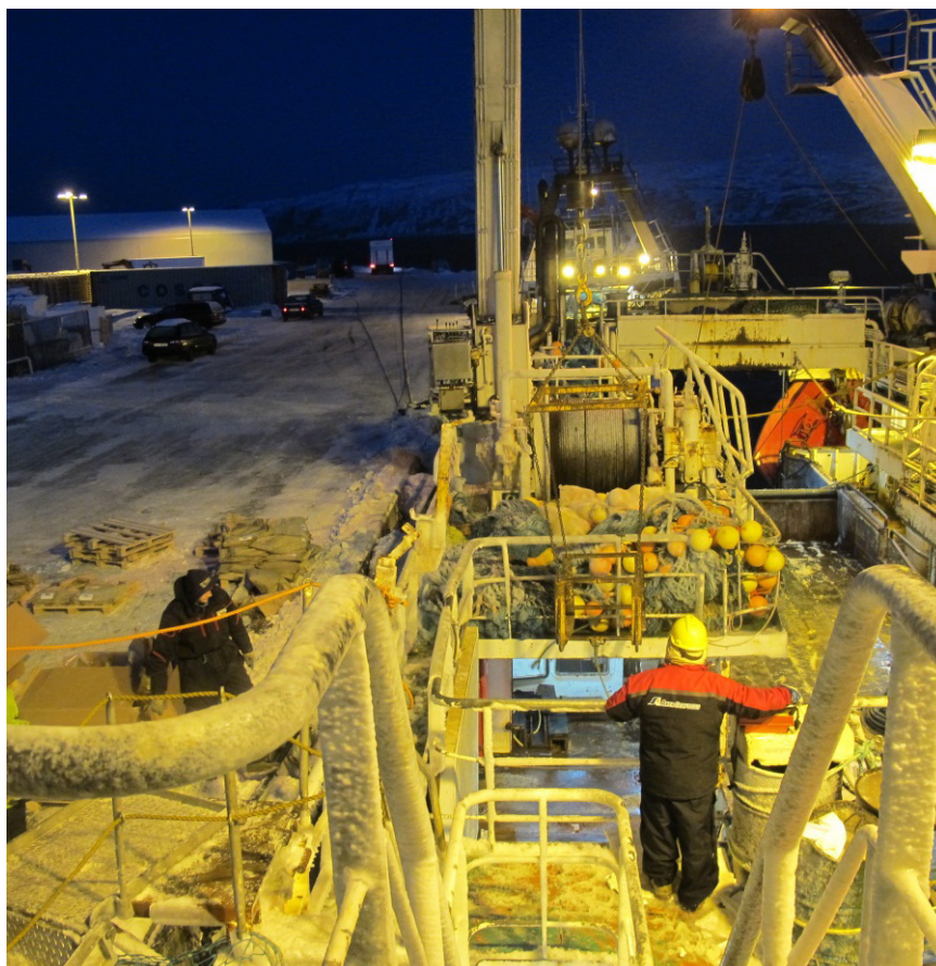
Bilde 4. Lossing pågår

I kystflåten er arbeidsmiljøet lite, både i antall og i areal, og fiskerne jobber tettere på hverandre. Dette fører til at kommunikasjonsbehovet, om det er språklig eller ikke, er annerledes enn på et større fartøy. En kystbåteier som hadde med seg en mann fra Latvia på fiske sa at det med språket gav seg mest utslag i forhold til at det ikke ble så mye "small-talk" om vær og vind på vei til og fra fiskefeltet. Under selve arbeidet gikk det veldig greit fordi behovet for språklig kommunikasjon var begrenset.