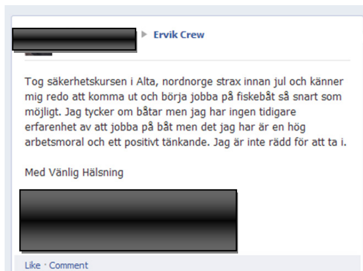
Bilde 3. Jobbsøknad på Facebook

At nettverk og anbefalinger er viktig bekreftes også av de utenlandske fiskerne vi har intervjuet, som i all hovedsak har fått jobb på norske fartøy gjennom kjente. Noen rederier benytter seg også av det de kaller "rekrutteringsagenter" i utlandet, i hovedsak i Russland og Baltikum. Ofte har også disse agentene tidligere jobbet for det norske rederiet og kjenner rederiet godt, og som rederiet stoler på. Disse får ansvar for å selektene kandidater på vegne av rederiet. På grunn av måten denne rekrutteringen er organisert kan den også defineres som en type nettverksrekruttering.