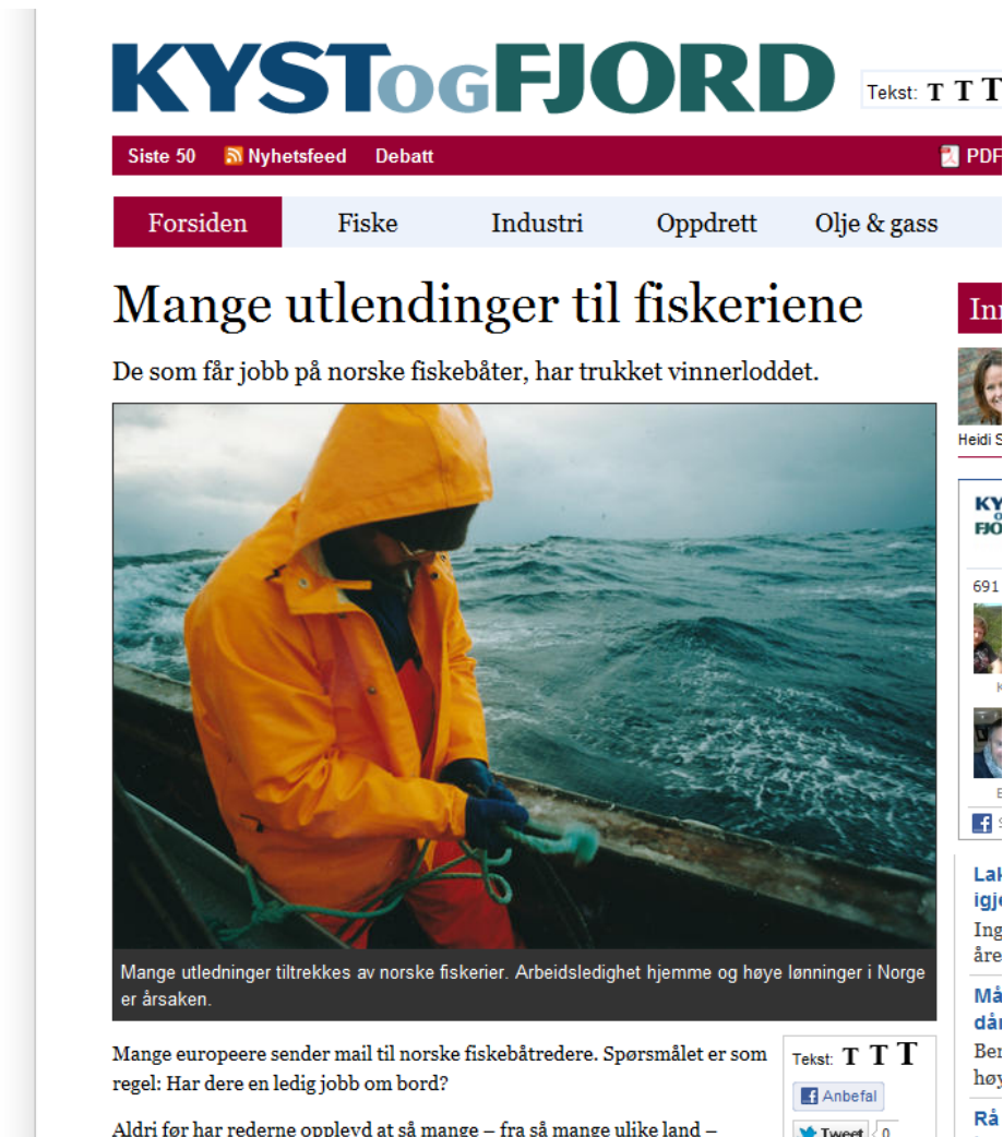
Bilde 1. Mange utlendinger til fiskeriene

I januar 2012 meldte nettavisa "Kyst og fjord" at norske redere aldri før har opplevd at så mange, fra så mange ulike land, ønsker seg jobb om bord i norske fiskebåter (se bilde 1). Her forteller redere om et tyvetalls henvendelser i uken fra utenlandske jobbsøkere. Hvor fiskere fra Island og Færøyene lenge har vært et vanlig innslag på norske fartøy, meldes det nå om økt pågang fra Sverige, Øst-Europa og søreuropeiske land som Hellas og Spania. Redere som siteres i artikkelen anser utenlandsk arbeidskraft som en ressurs, men påpeker at det kan være vanskelig å slippe gjennom nåløyet uten tidligere erfaring fra fiskeri.