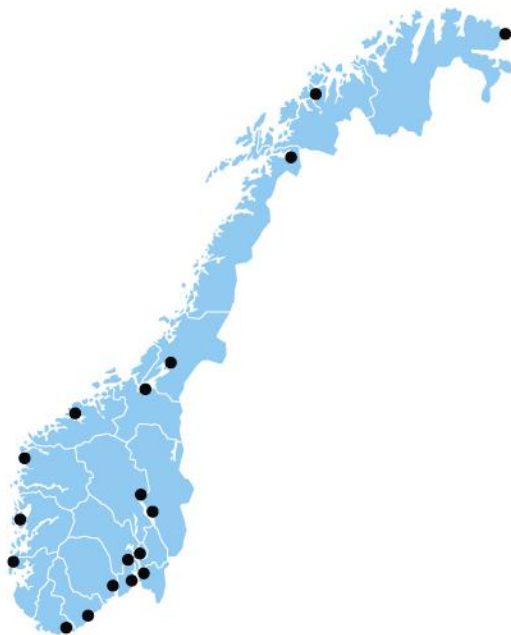
KONTORER I ALLE FYLKER