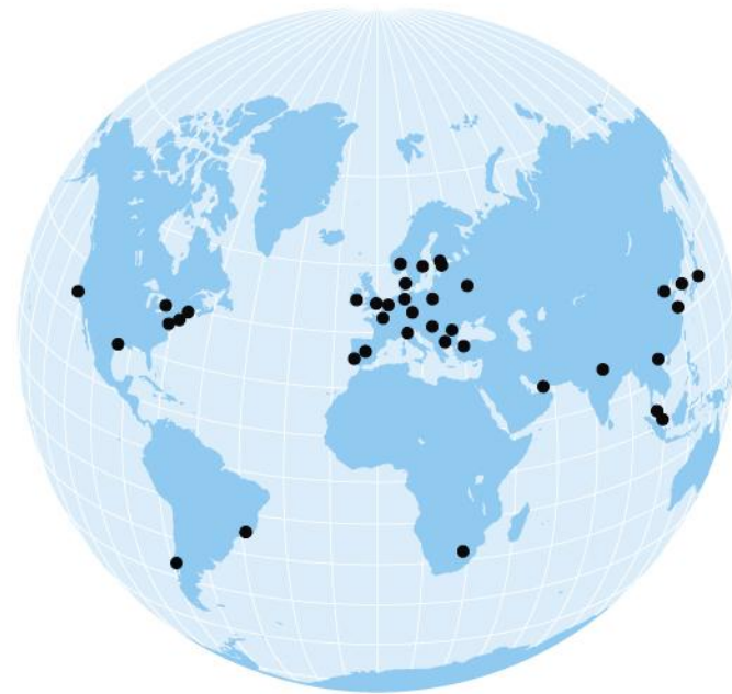
KONTORER I OVER 30 LAND