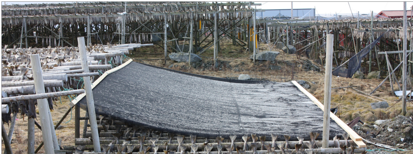
Tørrking av fisk under nett på hjell i sør/nord retning. Fisk under nettet henger i sør og fisk i kontrollgruppen uten nett henger i nordenden.