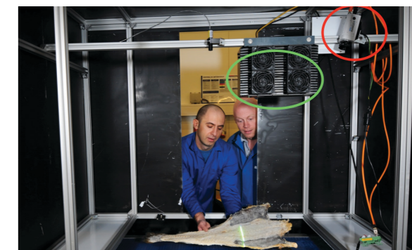
Slik ble maskinsynet gjennomført med 2D og 3D kamera i kombinasjon med laser.