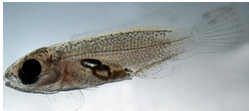
Foto av Berggylltlarve: Tora Bardal (Institutt for biologi, NTNU)

Av Kari Attramadal, Elin Kjørsvik (Institutt for biologi, NTNU), Gunvor Øie og Jorunn Skjermo (SINTEF fiskeri og havbruk)