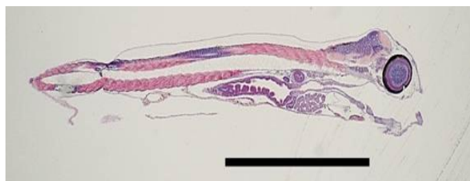
Berggylllarve 4 dager etter klekking. Streken er 1 mm lang.

Undersøkelsen avdekket også deformiteter hos en god del av larvene som hadde spiralformede neuralbuer. Det er usikkert om deformiteten som kun kan sees benfarget fisk har betydning for larvens funksjonalitet. Maren Ranheim Gagnat har i sine forsøk tatt ut prøver etter 4, 8 og 21 dager etter klekking for histologiske undersøkelser. Larver fra prøveuttaket er fiksert og støpt inn i parafinblokker for histologiske studier. Ved å farge snittene med tradisjonelt HE farging har hun kunnet beregne volumet av de ulike organgruppene for komparative studier.